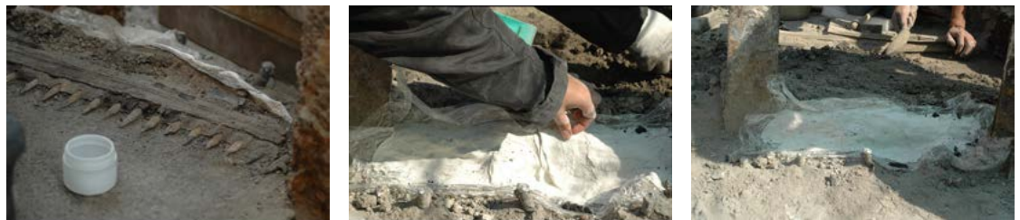
FIGURA 4. Ofrenda 165, extracción con vendas de yeso (Fotografía: Néstor Santiago, 2015; cortesía: Proyecto Templo Mayor [PTM], México).

Dependiendo de las características específicas de cada caso, para realizar los bloques se utilizan vendas de yeso o se construyen cajas —de madera o de cartón— que dan contención a los materiales de relleno, entre los que se encuentran: yeso, yeso con perlas de poliestireno (PS), perlas de poliestireno con adhesivos sintéticos, resina de poliuretano (PU) expansiva y resinas epóxicas (EP) de baja densidad (Araldit® o Ren Paste®). En casi todos los casos, estos bloques han servido como soportes auxiliares de trabajo en el laboratorio, y en muchas otras ocasiones forman también una base museográfica permanente para su exhibición dentro de las salas del Museo del Templo Mayor (MTM) (Figura 4).