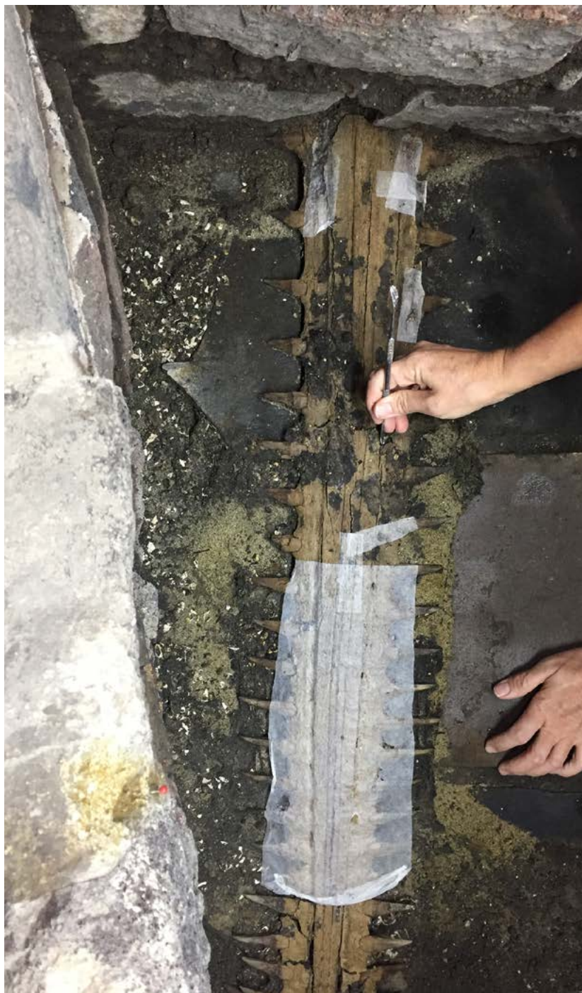
FIGURA 5. Ofrenda 174, colocación de velado.

El levantamiento del bloque requiere por lo menos dos o tres personas para asegurar una acción simultánea y homogénea en todo el elemento.