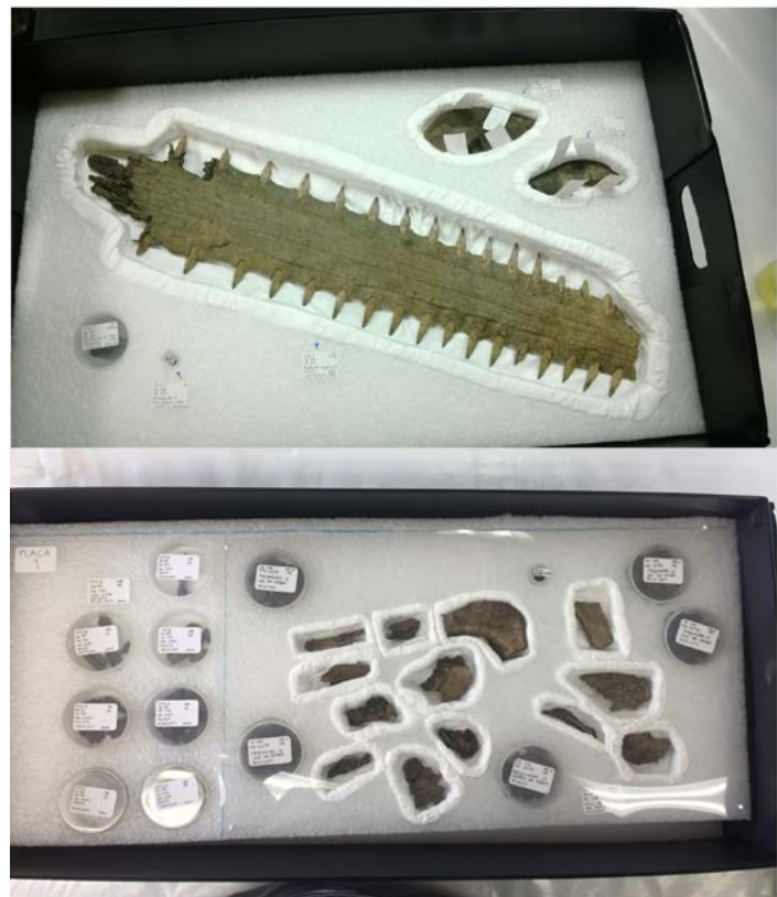
FIGURA 9. Embalajes de diferentes secciones anatómicas.

Finalizada la intervención de conservación, y de forma paralela con los análisis, se preparan embalajes de conservación que asegurarán la permanencia de las colecciones en condiciones óptimas. Éstos constan de cajas de polipropileno (PP) negro, fabricadas a la medida, que albergan placas de espuma de polietileno (PE, Ethafoam®) excavadas a la forma de los restos más susceptibles —como los cartílagos rostrales de pez sierra o las secciones de mosaico teselado—, evitando alteraciones por movimiento o vibraciones. Estas áreas talladas se cubren después con textil no tejido de fibras de polietileno de alta densidad (HDPE, Tyvek®) para evitar la abrasión en las superficies de los restos de fauna. Las vértebras, espinas caudales y dientes se colocan de manera individual en bolsas de polietileno herméticas y se acomodan en secciones específicas dentro de las placas de Ethafoam®. Es importante subrayar que los datos de la excavación acompañan siempre cada elemento, evitando confusión y pérdida de información (Sanromán y Barajas, 2022) (Figura 9).