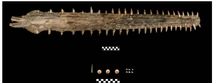
FIGURA 1. Arriba: cartílago rostral de pez sierra (Ofrenda 141). Abajo, de izquierda a derecha: espina caudal de mantarraya (Ofrenda 120) y dientes bucales de tiburón (Ofrenda 141) (Fotografía: Mirsa Islas y Érika Lucero Robles, 2016; cortesía: Proyecto Templo Mayor [PTM], México).

Los restos de esqueleto cartilaginoso se identifican por la peculiar morfología del mosaico de cartílago teselado, por sus vértebras bicónicas, o por el hallazgo de segmentos anatómicos distintivos, como los cartílagos rostrales de los peces sierra, los dientes bucales de tiburón, las espinas caudales de raya, así como los dentículos dérmicos (Figura 1).