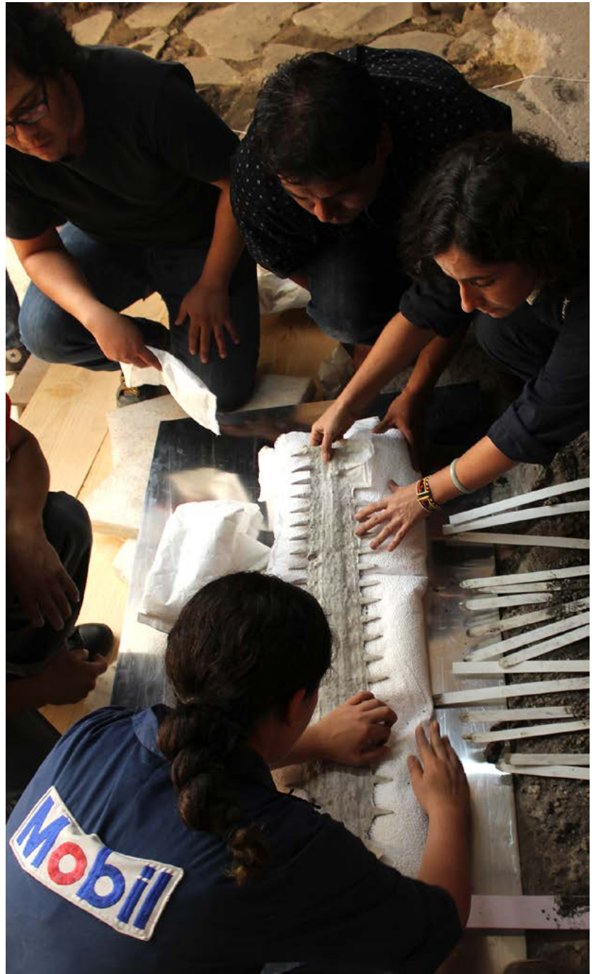
FIGURA 6. Ofrenda 171, soporte de perlas de poliestireno (Fotografía: Mirsa Islas, 2016; cortesía: Proyecto Templo Mayor [PTM], México).

En fechas más recientes, tras la extracción los elementos cartilagosos se colocan sobre una almohada de perlas de poliestireno, aisladas con plástico autoadherible y Tyvek®, que sirve como soporte de trabajo y puede modificarse según sea necesario durante la intervención (Figura 6).