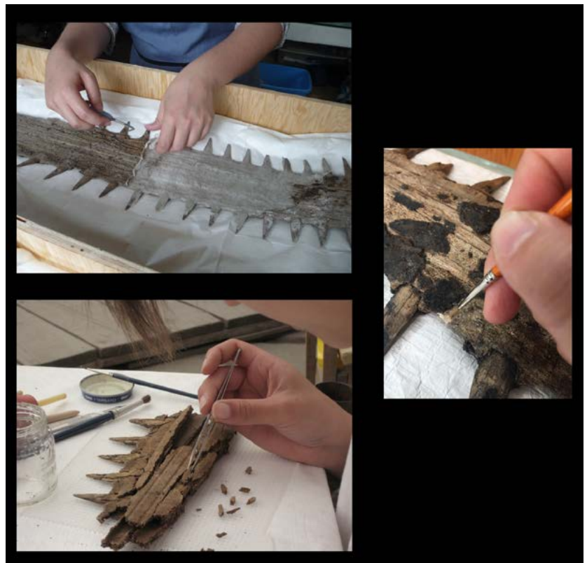
FIGURA 7. Procesos en el laboratorio de campo (Fotografías: María Barajas, Néstor Santiago y Adriana Sanromán; 2016, 2010 y 2017; cortesía: Proyecto Templo Mayor [PTM], México).

Finalmente, para dar unidad visual a las secciones resanadas o con reposiciones, se lleva a cabo la reintegración cromática con pinturas al barniz o acuarelas.