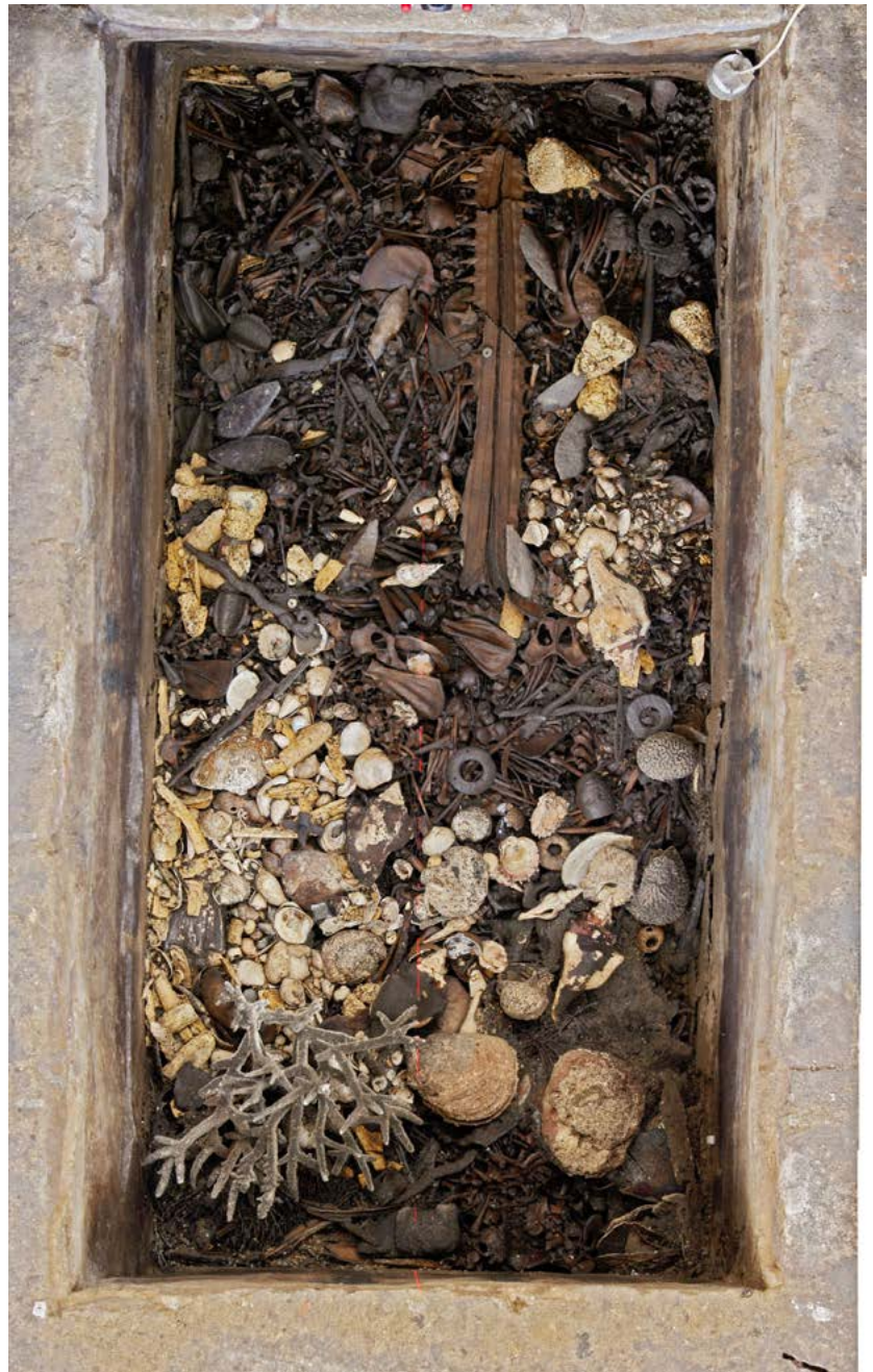
FIGURA 3. Ofrenda126 (Fotografía: Leonardo López Luján, 2008; cortesía: Proyecto Templo Mayor [PTM], México).