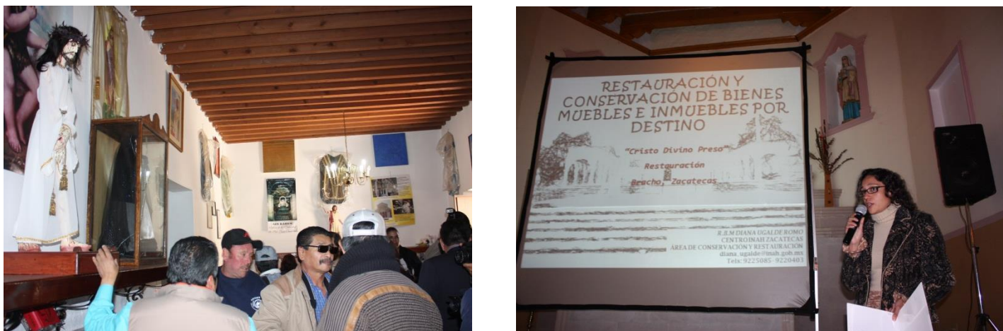
FIG 9. Entrega de obra a lugar de procedencia

Este caso reflejó, entre otros aspectos la importancia del registro y catalogación de bienes culturales como primer paso para su conservación además de otros factores como las medidas de seguridad en los recintos religiosos. Actualmente la Capilla de San Juan Bautista cuenta con cámaras de video y se implementaron medidas en los accesos para la protección del templo y sobre todo para su contenido.