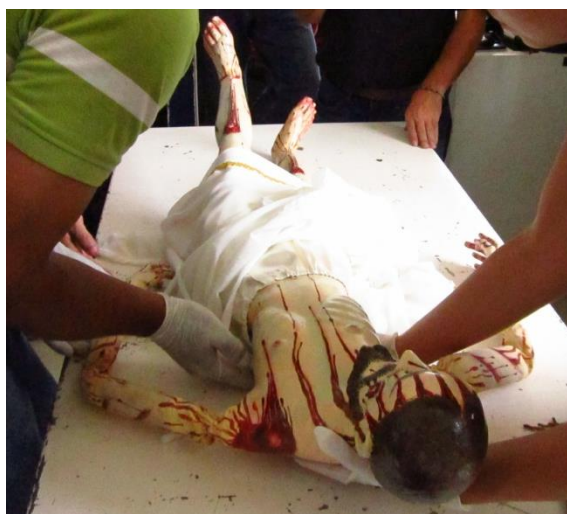
FIG 6. Cristo Divino Preso en PGR sede Zacatecas

Una vez rescatada la obra, fue sometida a un proceso de conservación y restauración de los daños ocurridos durante el robo, lo cual consistió en recuperar la estabilidad de la escultura en materia e imagen; cabe mencionar