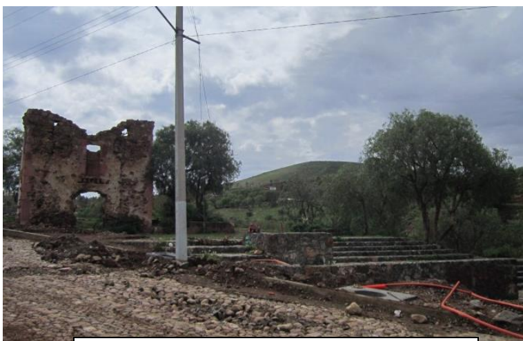
FIG 2. Ruinas de la primera capilla en Bracho

Es en la localidad de Bracho, nombrada así desde el siglo XVIII pues un rico minero Don Domingo Tagle Bracho reedificó lo que sería la primera iglesia en Zacatecas, donde nace la ciudad, actualmente solo quedan ruinas de lo que fue la primer capilla, la actual construcción es de finales del siglo XIX y ha tenido muchas modificaciones desde entonces, pero es en este histórico recinto y su contorno formado por un suave lomerío el escenario de la fiesta de moros y cristianos más interesante, más original, más pintoresca y más abigarrada de que se tiene noticia (Del Hoyo 1996:79).