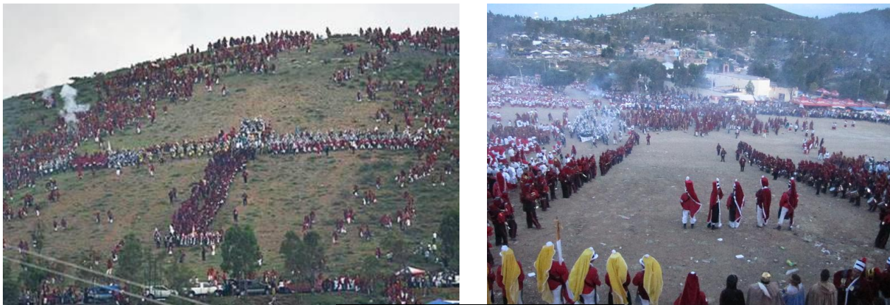
FIG 5. Las morismas de Bracho

Durante este festejo se realizan diversas misas dentro de la capilla y la Cofradía de San Juan Bautista es la que se encarga de toda la organización de este evento, además participa también en la procesión del silencio.