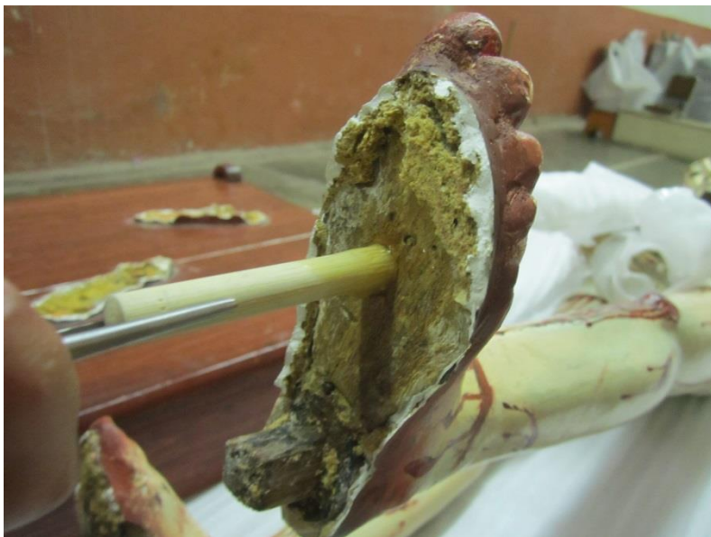
FIG 8. Durante procesos