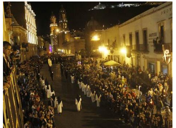
FIG 1. Procesión del Silencio, Zacatecas, 2013

Dicho delito consistió en el hurto de un bien cultural mueble considerado monumento histórico con grandes valores siendo parte de costumbres y tradiciones religiosas de la sociedad zacatecana, pues ésta obra ha adquirido gran importancia al ser integrante de la procesión del silencio, junto con otras imágenes de diversas características y diferentes procedencias; este evento se ha distinguido por ser una de las manifestaciones