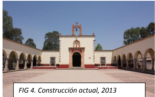
FIG 4. Construcción actual, 2013

La Morisma de Bracho se celebra anualmente en los últimos días de agosto, de manera que termine en el último domingo del mes; se desarrolla a lo largo de tres días con sus noches y consiste, fundamentalmente, en una representación dramática de índole muy peculiar que se representa en una