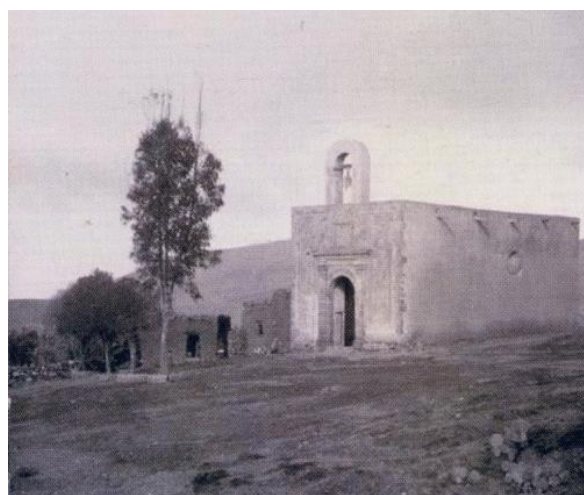
FIG 3. Capilla de San Juan Bautista, Bracho, Zac. 1890