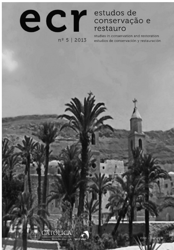
FIGURA 4. Portada del número 5 de ECR.

promover la difusión del conocimiento científico en régimen de acceso abierto.