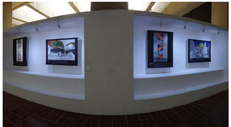
Fotografía: Stephanie Zamora