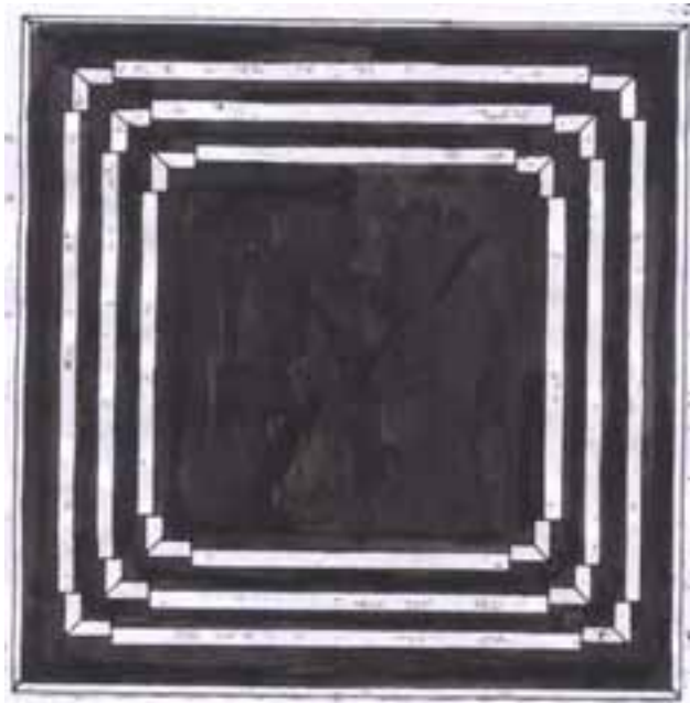
Figura 4: El basamento del templo 1 de Tikal de aproximadamente 30 metros de altura está dedicado también a los nueve niveles del jaguar del inframundo y frente a él en el poniente está el templo II de tres niveles los dos tienen planta de cruz griega. Estos templos eran de características elitistas ya que en el interior no cabían más de 20 personas. La figura 3 y 4 muestran que había un macro eje este oeste entre las Dinásticas tierras Mayas y los pueblos Guerreros del Altiplano Mexicano.

El poder sigue el camino diario y anual del sol joven y fuerte al amanecer, subiendo alcanza su mayor poder y altura al medio día brillando y calentando al mayor para entonces caer moribundo precipitándose al abismo de la muerte fría.