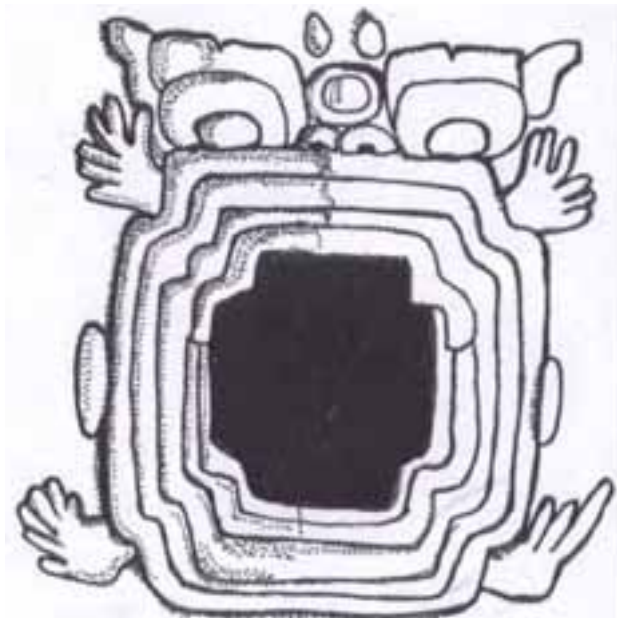
Figura 2: La entrada de la cruz celeste tenía un espejo en la tierra en la boca del monstruo de la tierra, este símbolo se diseñó desde el preclásico como en este relieve de Chalcatzingo. Donde una serpiente fantástica representa a la cueva de la montaña sagrada, al hoyo negro del cielo.

Esos caminos llevaban a otra realidad al interior de la otra gran deidad la Tierra que era en su interior un espejo del cielo. A mitad de este tenebroso camino en lo más profundo se ubica una cancha de juego de pelota donde jugaban los soles muertos y los ancestros, las calaveras del ciempiés y la luciérnaga dueñas del protocolo, las cuentas, los ciclos y las reglas de sucesión.