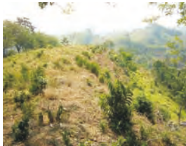
Detalle de las estructuras que conforman el sitio de Chinikihá.

Agradecemos al Arqlgo. Alfonso Morales, las fotografías proporcionadas para la elaboración de nuestros artículos.