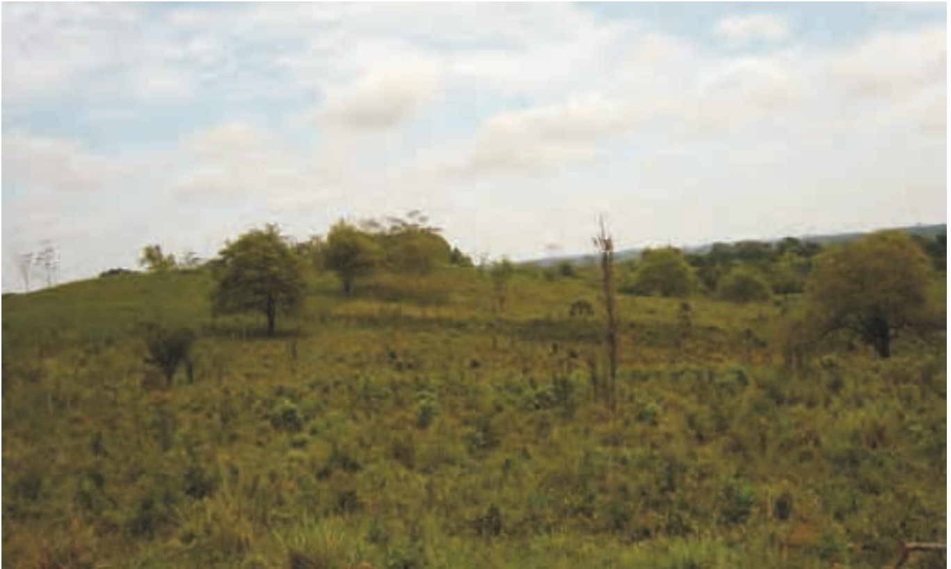
Vista general del sitio arqueológico de Chinikihá.