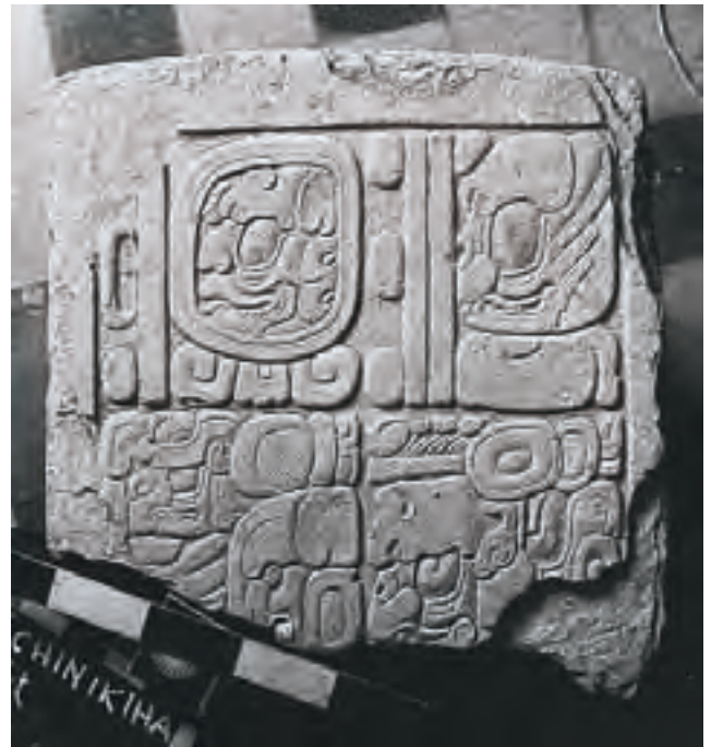
Detalle del panel No. 2 de Chinikihá.

Primero: describir de manera detallada la trayectoria política de Chinikihá. En términos generales, los antecedentes de investigación en el área permiten establecer una larga secuencia de ocupación para el sitio de Chinikihá que va desde el Formativo Tardío (250 a. C) al Clásico Terminal (850 d. C.).