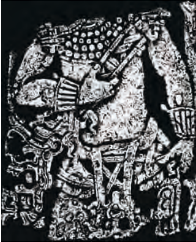
Figura 4. Trono 1 de Chinikihá.

juego de pelota, e inscripciones (1996: 48-52, 89-90). En febrero de 2003 David Stuart y un grupo de investigadores visitan Chinikihá y elaboran un reporte que constituye la síntesis más completa hasta la fecha sobre la historia del sitio.