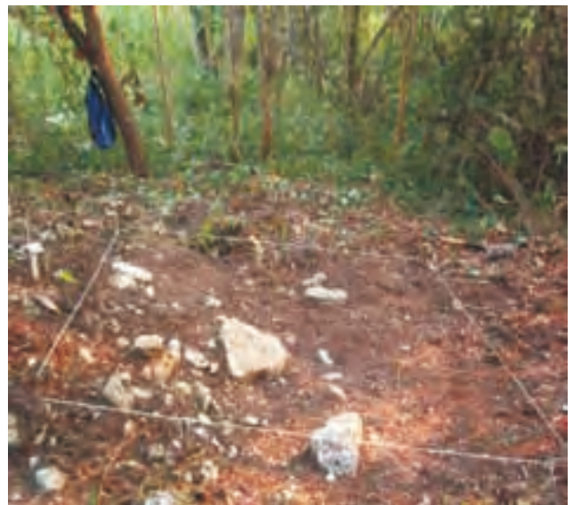
Figura 3. Pozos de sondeo realizados en la temporada 2003.

Los materiales obtenidos por Rands de Chinikihá fueron tratados en diversas publicaciones e informes en 1965 y 1967. En 1972 dos fragmentos de piedras esculpidas provenientes del sitio fueron incluidas en una recopilación de calcas realizadas sobre monumentos inscritos del área maya (Greene, Rands, Graham, (1972: 40-43). Finalmente, en 1993 el sitio fue visitado por Alfonso Grave Tirado (como parte del proyecto Especial Palenque), quien realiza un croquis aproximado de la zona monumental del sitio y varios pozos y calas en algunas de sus estructuras. Chinikihá fue incluido también en el trabajo de tesis de dicho autor, quien cataloga al sitio como de tipo o rango 2, al que define por la presencia de estructuras tipo palacio,