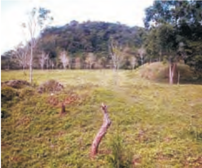
Vista general de la Plaza de Chinikihá, al fondo pueden apreciarse algunas estructuras.