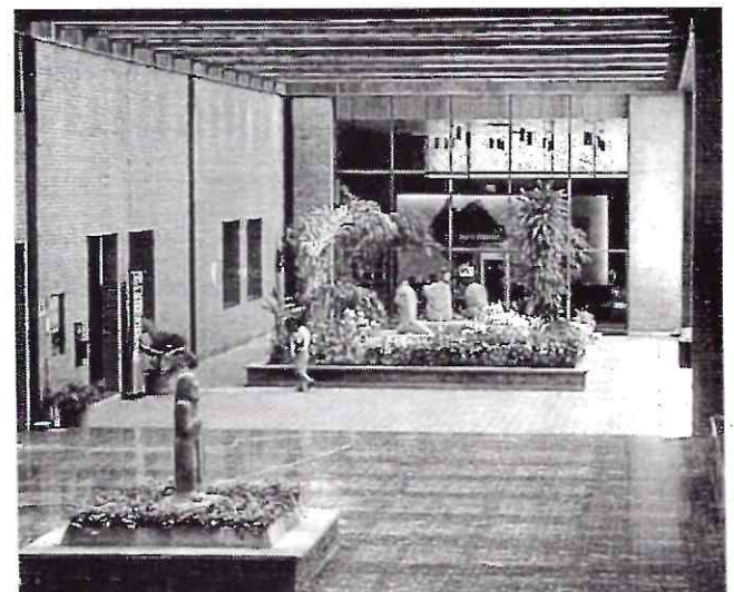
Instalaciones del Centro INAH Chiapas y Museo Regional en Tuxtla Gutiérrez.