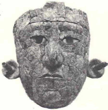
Máscara de la Reina Roja Templo XIII ó de la Reina Roja