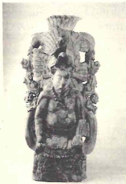
Portaincensario Edificio 3, Grupo B

Cerámica 34 cm de ancho por 71 cm de alto