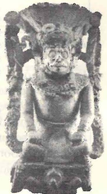
Portaincensario cilíndrico, Grupo B.