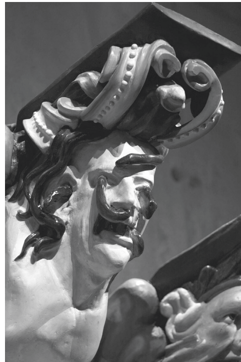
Memento mori (recuerda que morirás). La cabeza con serpientes reptando por las cavidades faciales simboliza los tormentos del infierno. Foto: Stefan Evensen, SMM. Izquierda: Buzo con un hallazgo. Foto: Archivo SMM, ca. 1961