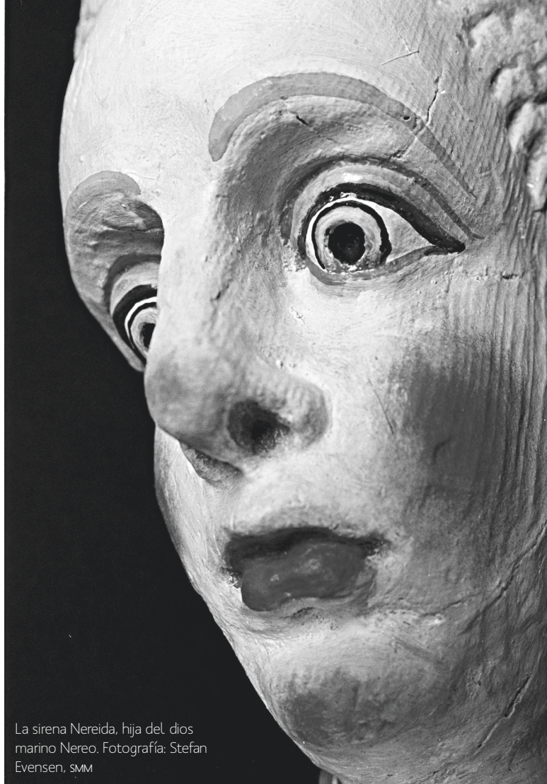
La sirena Nereida, hija del dios marino Nereo.