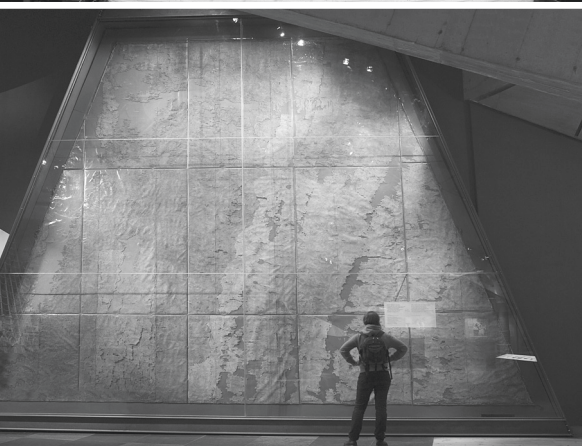
La vela conservada más antigua del mundo y que, con sus 32 m 2 , era la más pequeña del Vasa . Foto: Karolina Kristensson, SMM. Arriba: Modelo del Vasa a escala 1:10. Foto: Karolina Kristensson, SMM