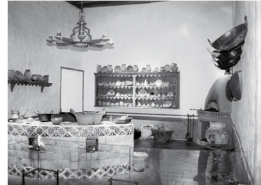
Un espacio con memoria.

Al respecto, los autores indican que el patrimonio surge cuando una comunidad cultural le da forma a esos lazos de conectividad y pertenencia, otorgándole calidad de representación a los bienes tangibles e intangibles que cada persona o grupo social le atribuye.