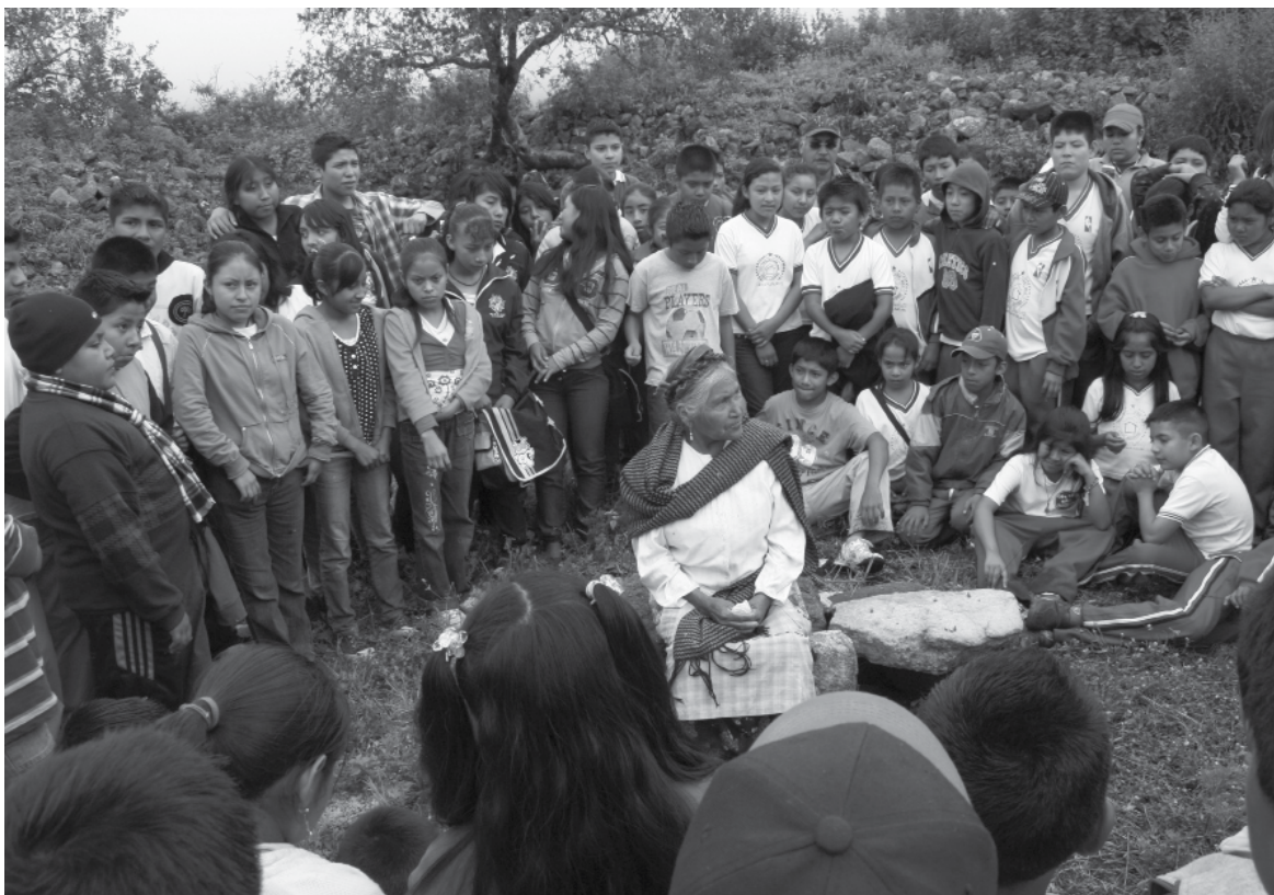
Un museo de incertidumbres es un museo incluyente.