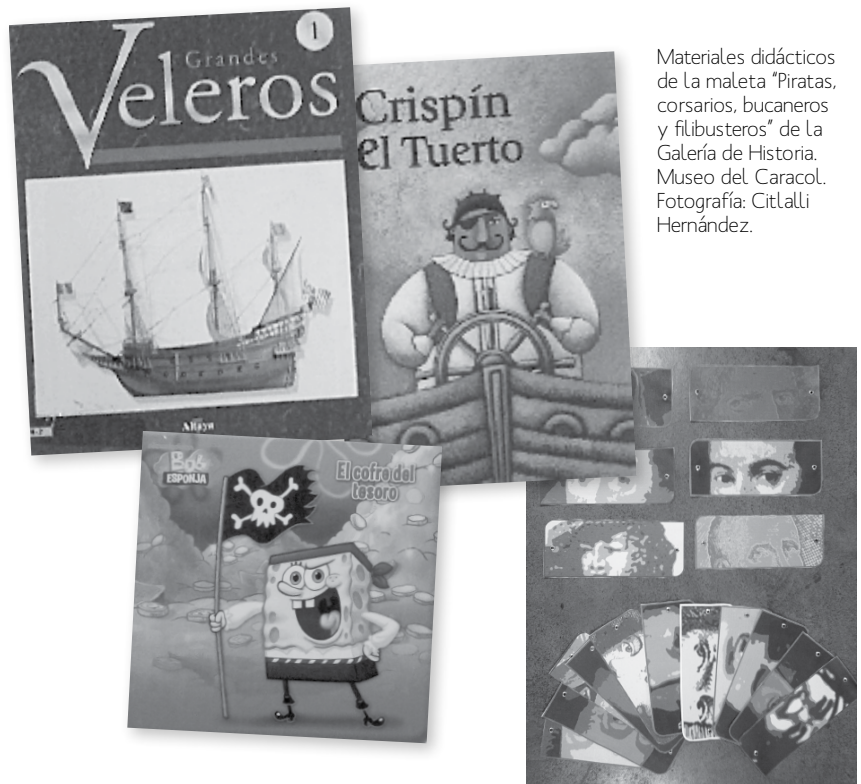
Materiales didácticos de la maleta "Piratas, corsarios, bucaneros y filibusteros" de la Galería de Historia. Museo del Caracol.