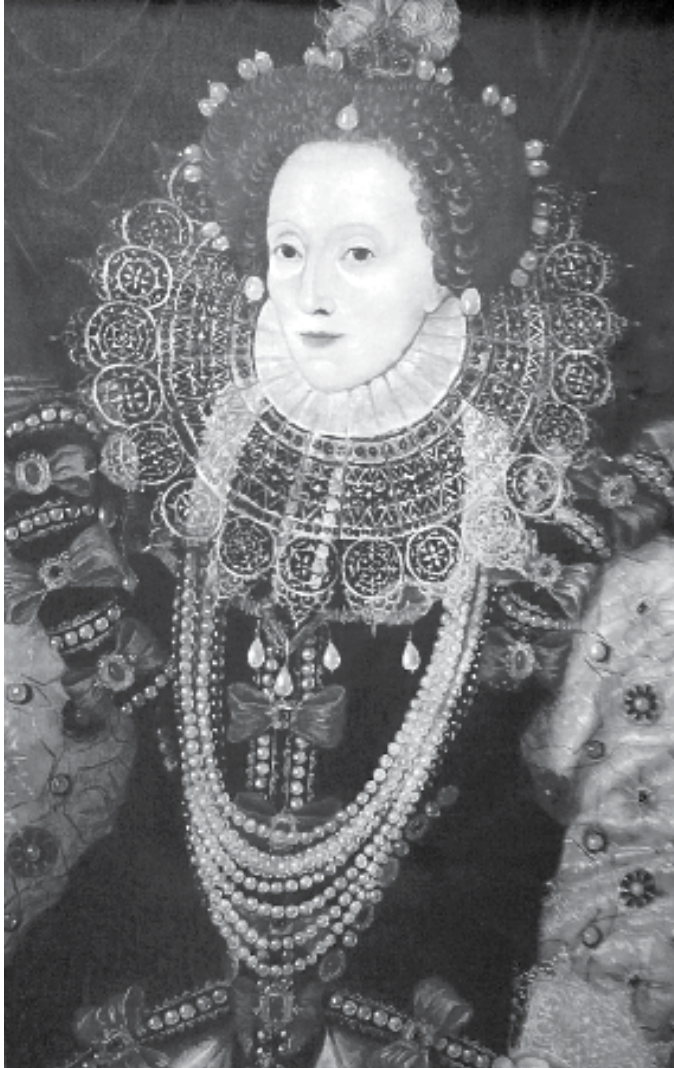
Materiales didácticos de la maleta "Piratas, corsarios, bucaneros y filibusteros" de la Galería de Historia. Museo del Caracol.