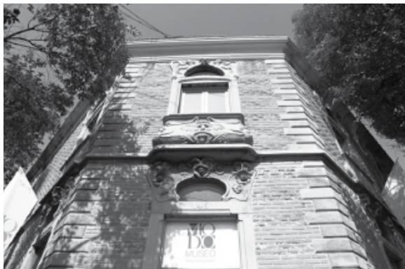
fachada del Museo del Objeto del Objeto.

El museo pretende analizar y profundizar en los alcances de la comunicación, especialmente en las nuevas tecnologías. Cuenta con un acervo de aproximadamente 30 mil objetos que tienen que ver con el diseño de empaques, envases, carteles publicitarios y demás soportes de las artes gráficas.