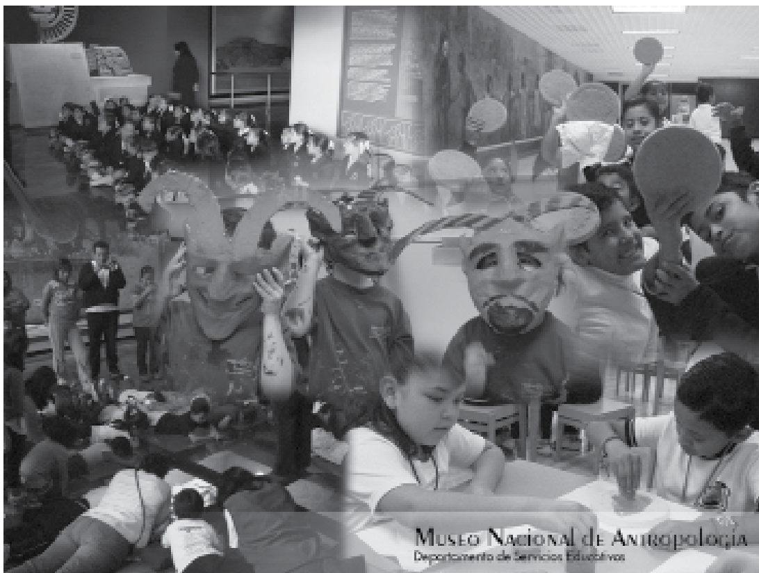
Collage de las actividades educativas del Museo Nacional de Antropología.

En la construcción del discurso del museo intervienen de manera definitiva la mirada y percepción del público. Aunado a la percepción del visitante se encuentra el trabajo de los gestores de patrimonio cultural y de los asesores educativos, quienes encauzan y enriquecen el diálogo creado entre la institución y su público.