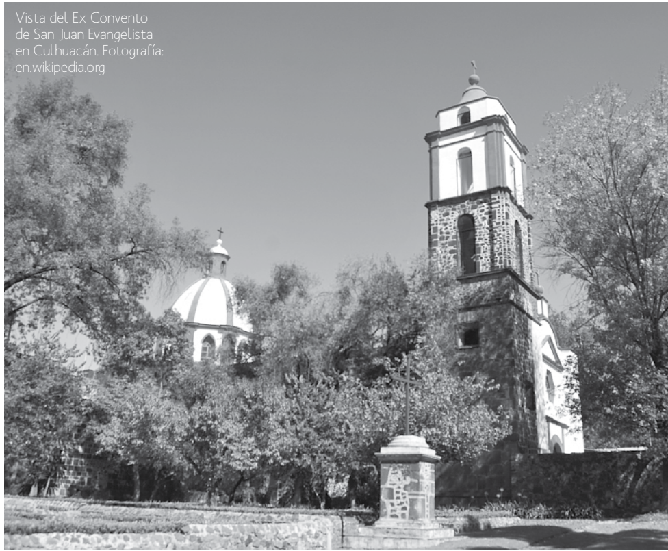
Vista del Ex Convento de San Juan Evangelista en Culhuacán.