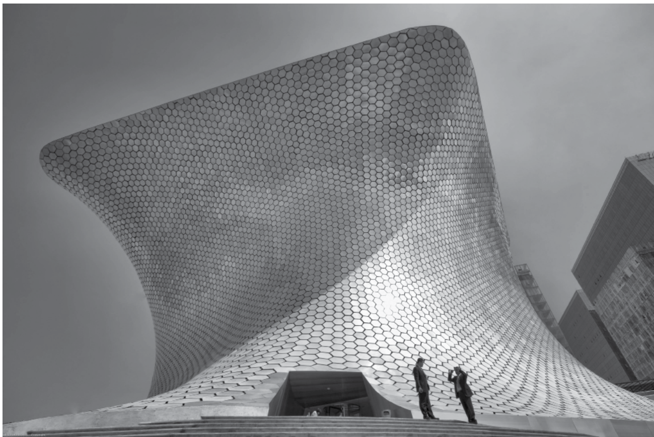
fachada del Museo Soumaya en La Ciudad de México.

convertido, sesión con sesión, en un espacio de libertad en el que cada voz es escuchada y valorada. Los participantes, entendidos como una comunidad de aprendizaje, 3 exploran las colecciones al tiempo que se reconocen como creadores de su propia experiencia y responsables de su proceso de interacción con el entorno.