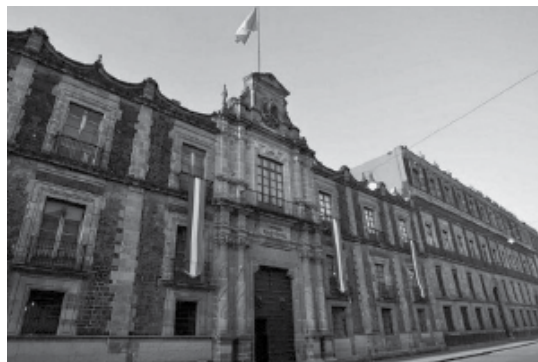
Arriba: Fachada del Museo Nacional de las Culturas. Abajo: Logotipo del Museo Nacional de las Culturas.