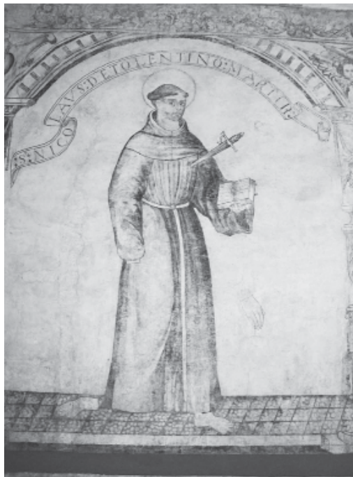
Arriba: Pintura mural dentro del Centro Comunitario de Culhuacán. Página anterior: Cenefa dentro del Centro Comunitario de Culhuacán.

“ Por medio de visitas participativas se trata de inducir al visitante a que descubra, imagine e interprete lo que nuestra colección comunica. ”