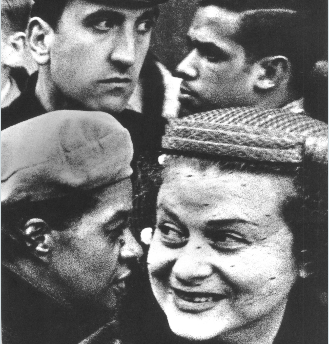
5. William Klein, Cabezas , Nueva York (1954). No pertenece a la colección Julián Castilla, aunque sí otras obras de Klein.