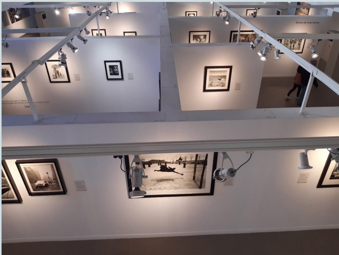
Figura 7. Panorámica de la sala principal del Museo de Arte Contemporáneo El Mercado, con la exposición Instantes decisivos . En primer plano aparece la fotografía de Ramón Masats, Seminaristas jugando al fútbol (1959) conservada también en el MOMA, de Nueva York.