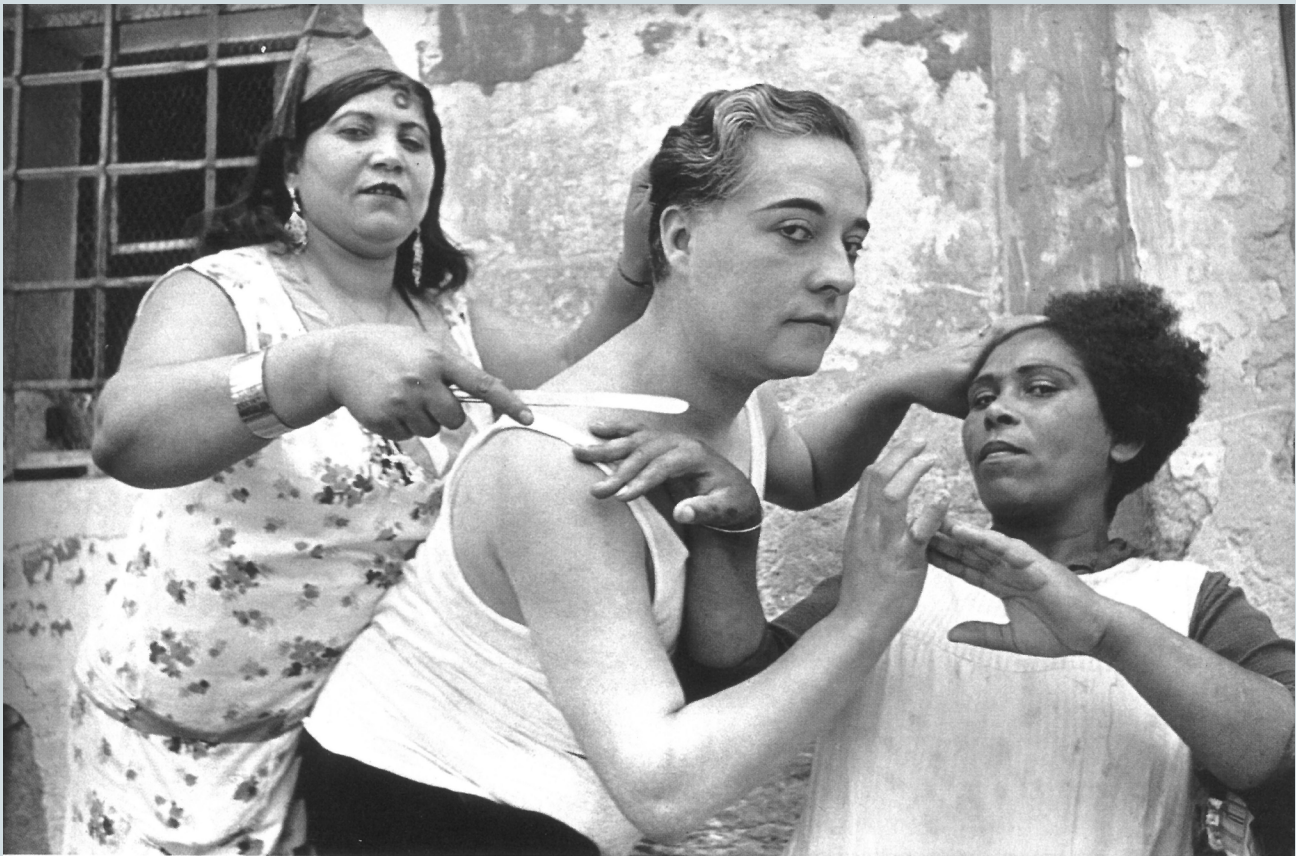
2. Henri Cartier-Bresson. Alicante, España (1933) . No pertenece a la colección Julián Castilla, aunque sí otras obras de Bresson.