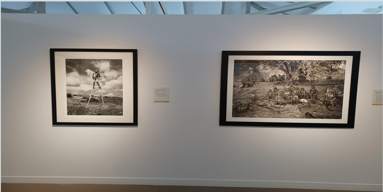
3. Sala 5. “Gentes de otras tierras” con fotografías de Ángel Guitérrez y Vicente López-Tofiño. Escenarios de tradiciones y costumbres de Etiopía; con esa etnografía propia de cada pueblo, cuyo valor reside en su diversidad. Fotografía del autor en la muestra de Villanueva de los Infantes.