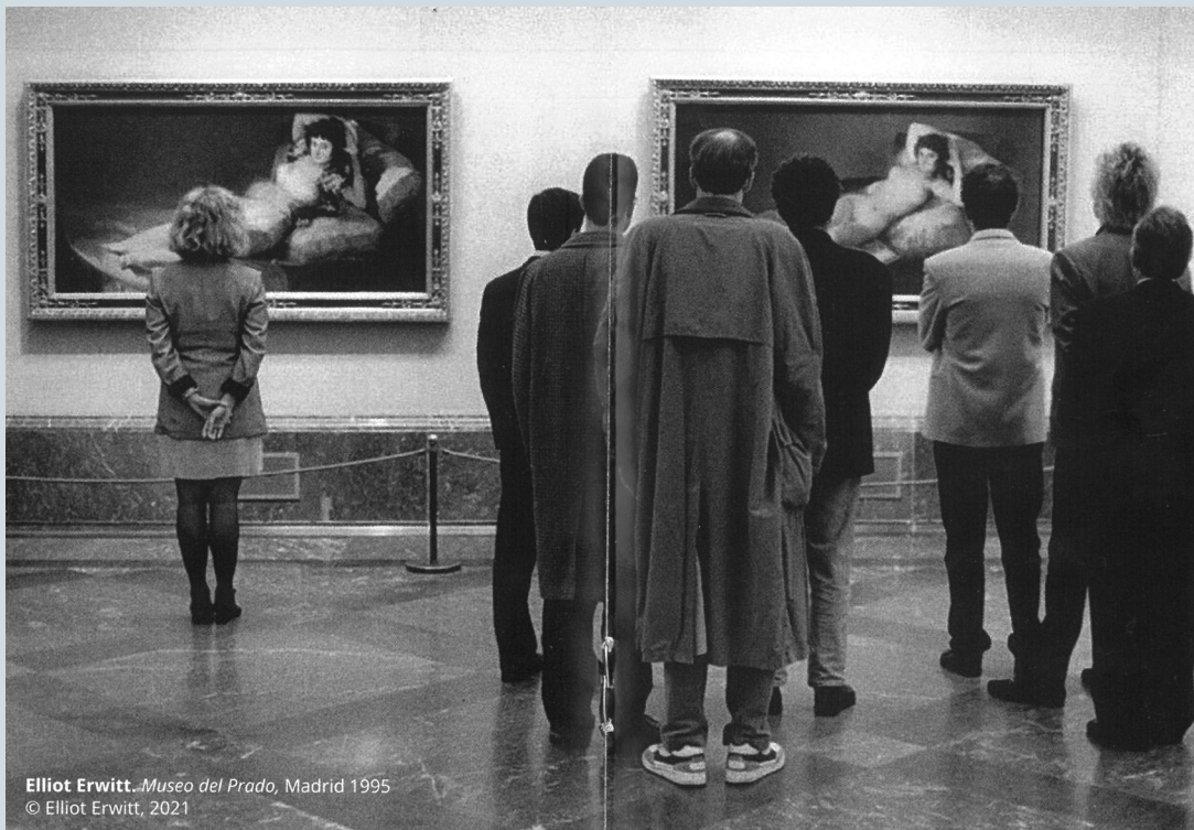
Elliott Erwitt. Museo del Prado, Madrid 1995