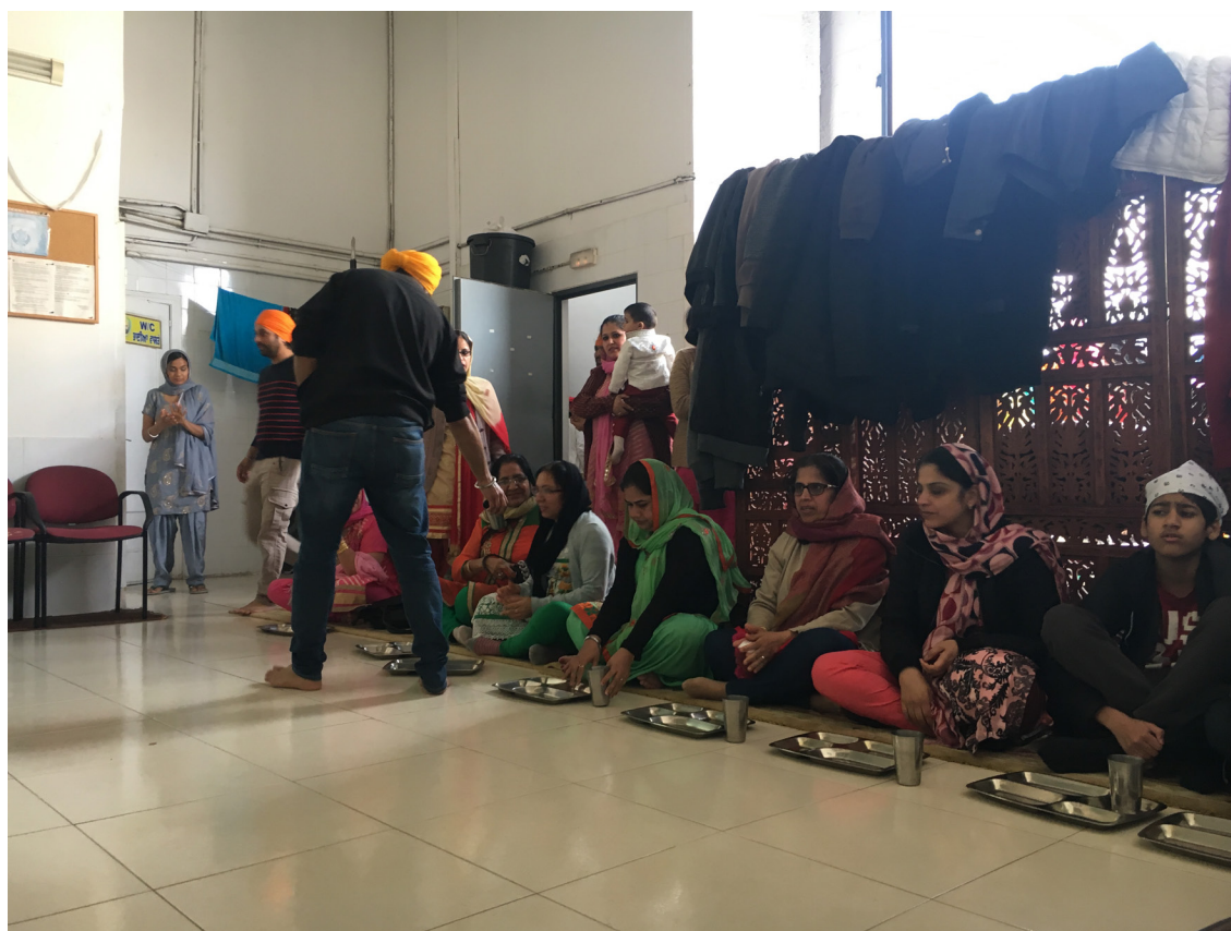
Figura 2. Langar dominical en el gurdwara Nanaksar Sahib , Villaverde, Madrid, España.