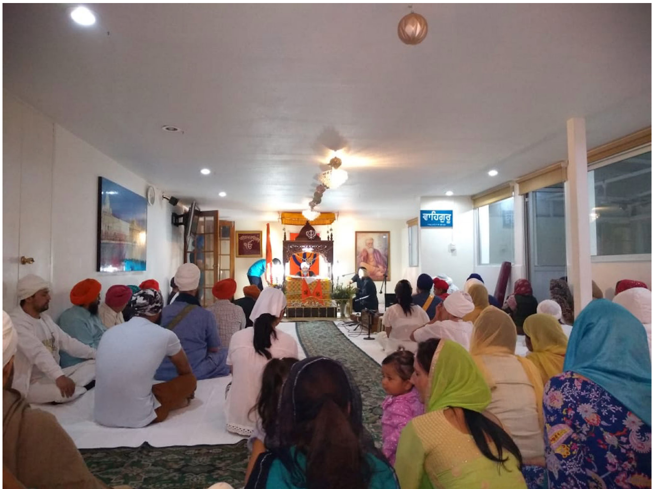
Figura 5. Gurdwara en Tecamachalco, Estado de México, México.

Con ello, se puede constatar que la comunidad sikh en México, se conformó en sus inicios, en la década de los setenta, por conversos. La des-localización del sikhismo se concretó específicamente por un migrante indio, Yogi Bhajan, quien comenzó a dar clases de yoga y, posteriormente, amalgamó esta práctica al sikhismo, religión de la cual era practicante. Su llegada a América se dio en una coyuntura favorable, pues, en la época hippie estaban en boga las espiritualidades orientales. La trans-localización y la re-localización se efectuaron eficazmente, gracias a la habilidad de Bhajan para detectar las necesidades de sus alumnos-discípulos y por configurar una espiritualidad que se adaptara a los devotos mexicanos, integrando figuras católicas, como la Virgen de Guadalupe. Imagen que es capaz de unificar a toda una nación. Además, integró saberes tradicionales, como la herbolaria.