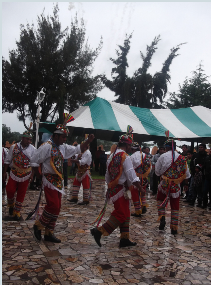
7. Grupo de danzantes presentando su acto en el atrio y frente a la puerta de la iglesia. Fotografía: Anna Rosa Herrera Gómez, julio de 2015.