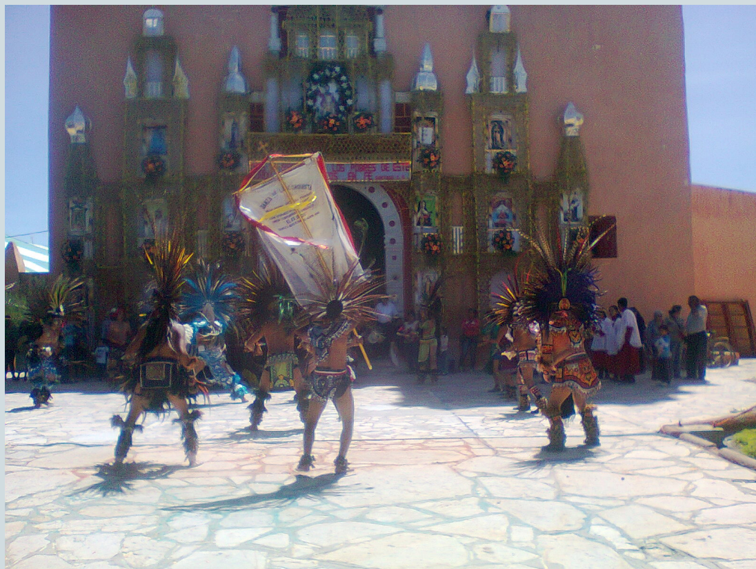
6. Grupo de danzantes llamados “Danza Azteca Santísima Trinidad”, de la comunidad de Demacu, presentando su acto en el atrio y frente a la puerta de la iglesia. Fotografía: Anna Rosa Herrera Gómez, julio de 2014