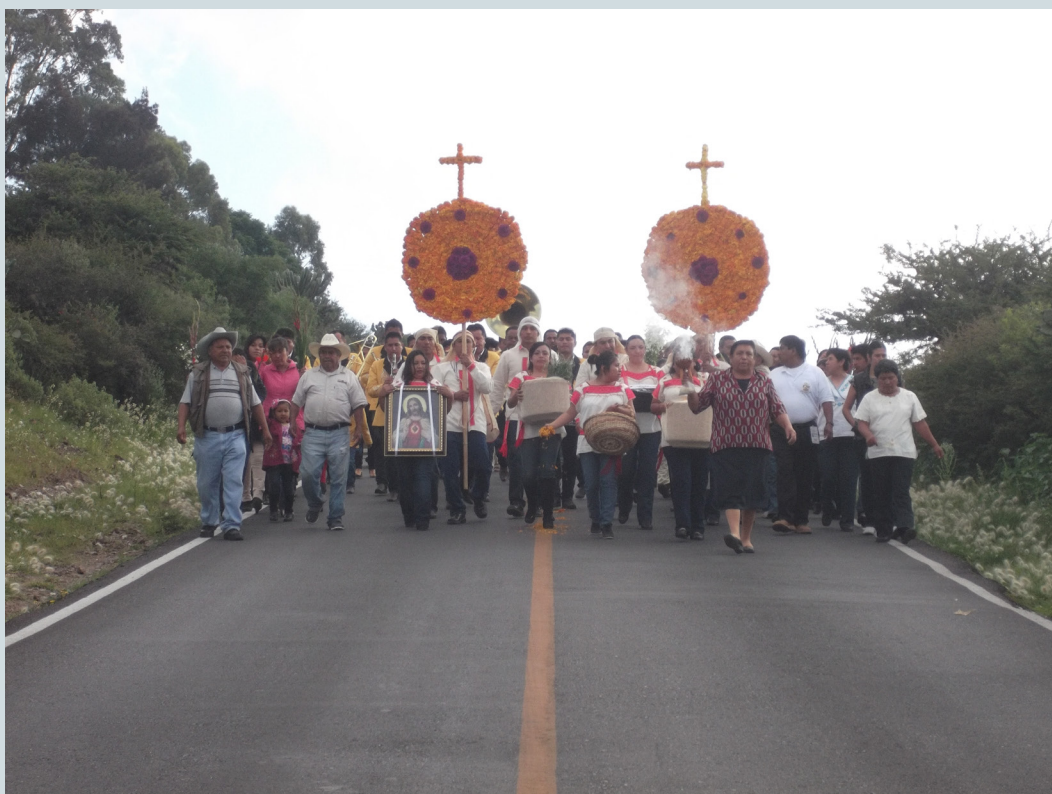
12. Procesión de los mayordomos rumbo a la iglesia para entregar la ofrenda. Van acompañados por la banda musical y feligreses que llevan flores blancas y rojas. Fotografía: Anna Rosa Herrera Gómez, julio de 2014.