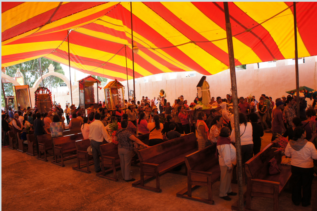
5. Imágenes de las diversas comunidades entrando a la capilla abierta para la celebración de la misa de recibimiento de las imágenes de visita a la fiesta, la cual es presidida por el párroco principal. Fotografía: Anna Rosa Herrera Gómez, julio de 2014.