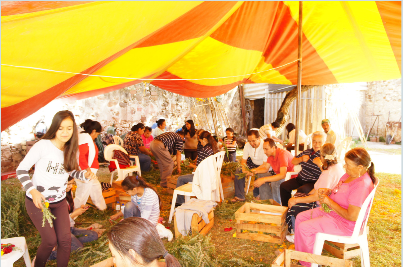
15. Grupo de voluntarios trabajando juntos, elaborando las reliquias que serán utilizadas para realizar las limpias. Estos manojos se hacen con romero y flores que desprenden de los arreglos de las ofrendas. Fotografía: Anna Rosa Herrera Gómez, julio de 2014.