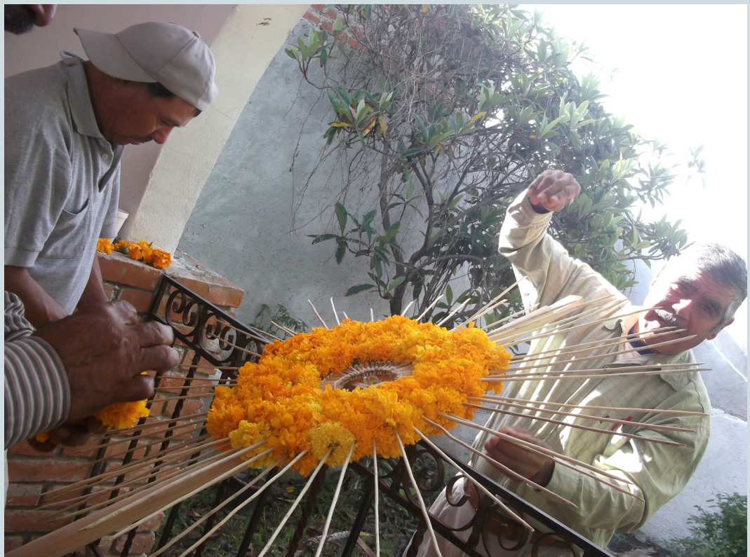
10. Especialistas elaborando los arreglos florales. Se puede observar cómo están ensartando las flores de cempohualxochitl en las varitas de kaxnato . Fotografía: Anna Rosa Herrera Gómez, julio de 2014.