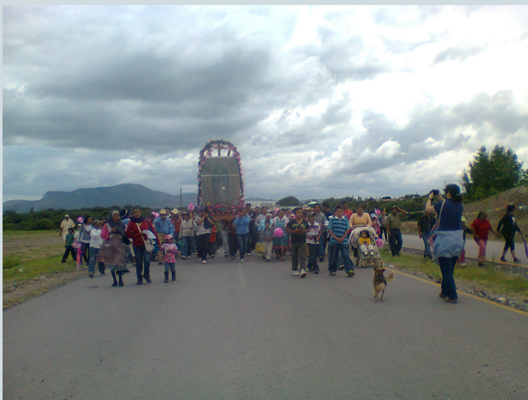
4. Llegada de una de las procesiones de feligreses llevando una de las imágenes de visita a la fiesta. Fotografía: Anna Rosa Herrera Gómez, julio de 2014.