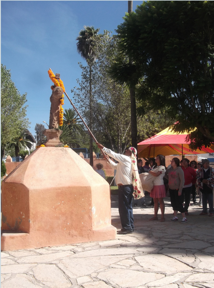
13. Mayordomo colocando una cuelga hecha de flor de cempohualxochitl en la cruz atrial como parte de la ofrenda entregada al santo patrono Santiago Apóstol. Fotografía: Anna Rosa Herrera Gómez, julio de 2015.