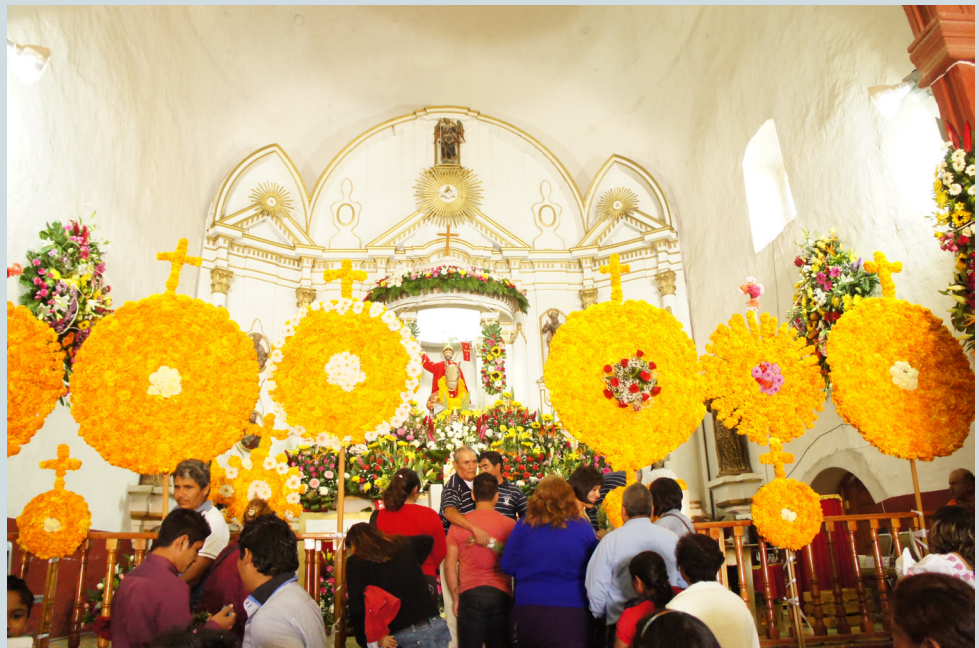
14. Arreglos colocados en los barandales que separan el altar de la iglesia del área de las bancas. Se puede observar a mayordomos y otras personas encargadas haciendo las limpias a los feligreses visitantes. julio de 2014.