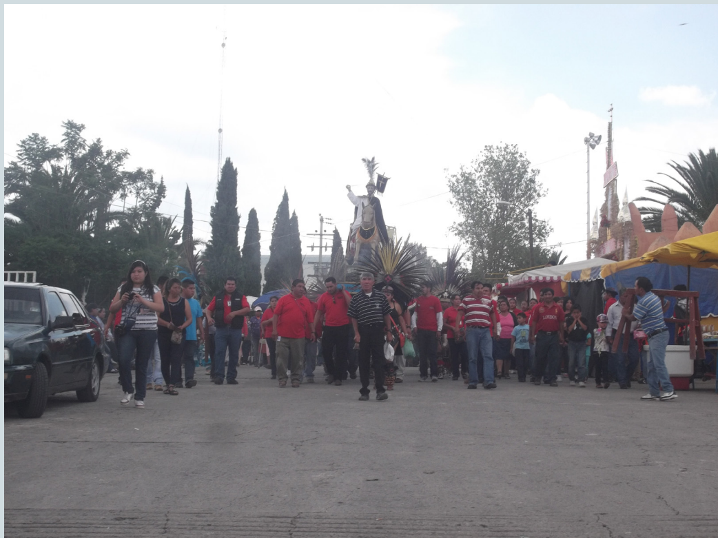
3. Salida de la imagen de Santiago Apóstol de la iglesia en procesión para recibir a las imágenes de visita. La imagen es cargada por miembros del comité de la iglesia y van acompañados por un grupo de danzantes. Fotografía: Anna Rosa Herrera Gómez, julio de 2015.