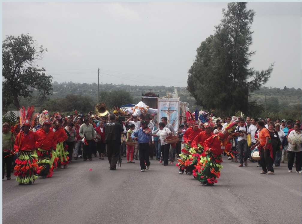
2. Grupo de danzantes durante su presentación a manera de recibimiento de las imágenes de visita, entre ellas, la imagen del Cristo Divino Salvador de Dajiadhi. Fotografía: Anna Rosa Herrera Gómez, julio de 2015.