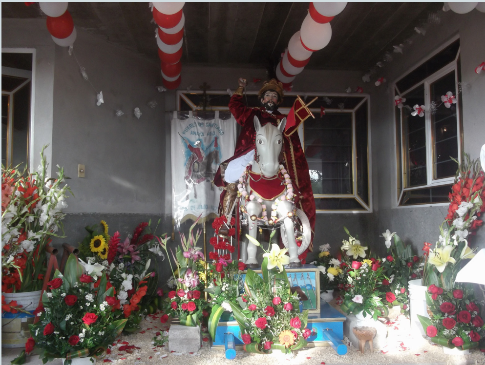
1. Altar en la casa donde es recibida la imagen de Santiago Apóstol durante la novena. Está posado sobre aserrín, colocado en forma de tapete y alrededor se ponen flores rojas y blancas. La figura de Santiago Apóstol tiene colocadas cuelgas hechas de alimentos dulces (bombones, chocolates, galletas). Fotografía: Anna Rosa Herrera Gómez, julio de 2014.