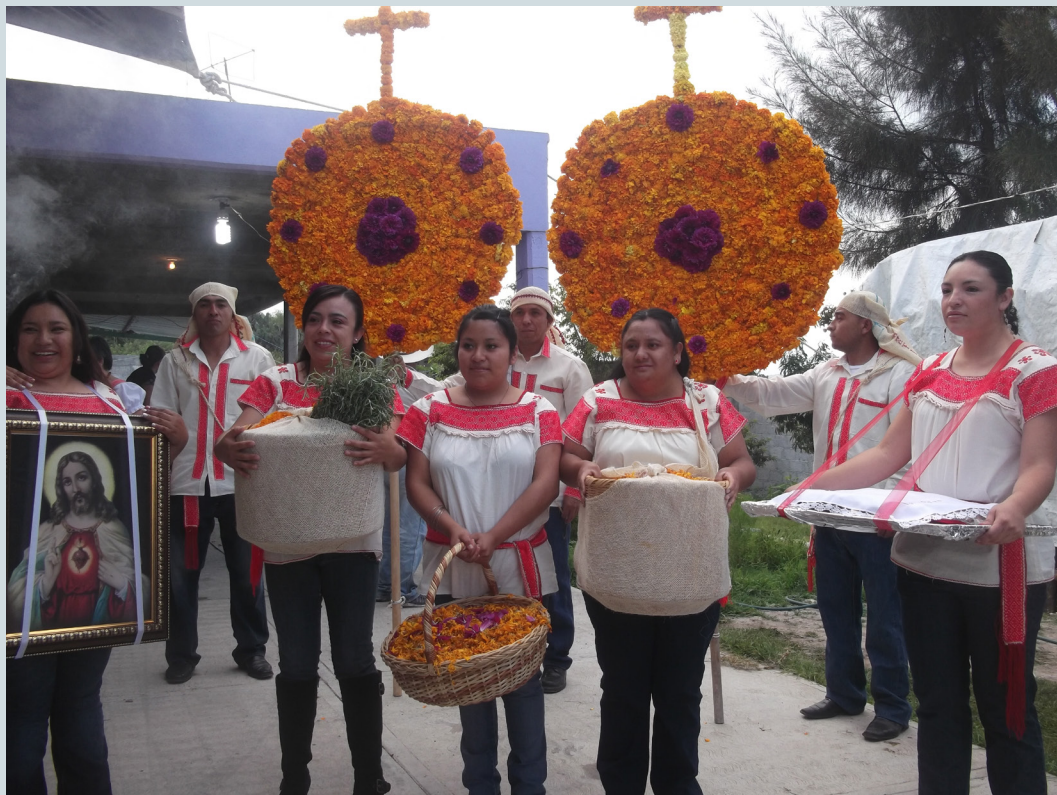
11. Mayordomos a punto de salir de la casa en procesión con la ofrenda, portando ropas tradicionales de la región que consisten en blusas o camisas de ixtle y ayates. Fotografía: Anna Rosa Herrera Gómez, julio de 2014.