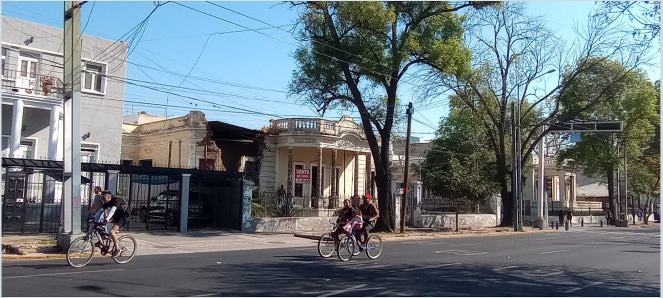
Foto 9. Casonas que en los años cincuenta tuvieron su máximo esplendor, actualmente están en claro deterioro y listas para la venta. Fotografía: Luis Adolfo Ortega Granados, 2023.