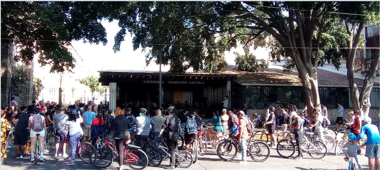
Foto 8. Como parte de la plasticidad de los espacios, entre movilidad e inmovilidad, la vía apela a la inmovilidad para convertirse en auditorios al aire libre.