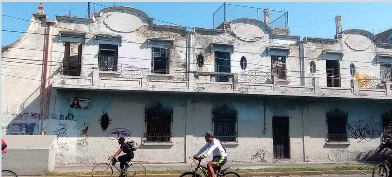
Foto 3. Como parte de la arqueología de la vivienda, algunos inmuebles muestran un claro deterioro arquitectónico, convirtiéndose en la presa para los desarrolladores de torres “smart”.