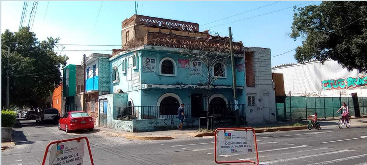
Foto 4. Parte de la plasticidad de las viviendas, que en ocasiones se convierten en murales para propaganda política. Fotografía: Luis Adolfo Ortega Granados, 2023.