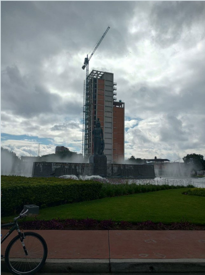
Foto 14. Ya en la Glorieta y a espaldas de la Minerva, se refrenda la verticalización de la vivienda. Fotografía: Luis Adolfo Ortega Granados, 2023.