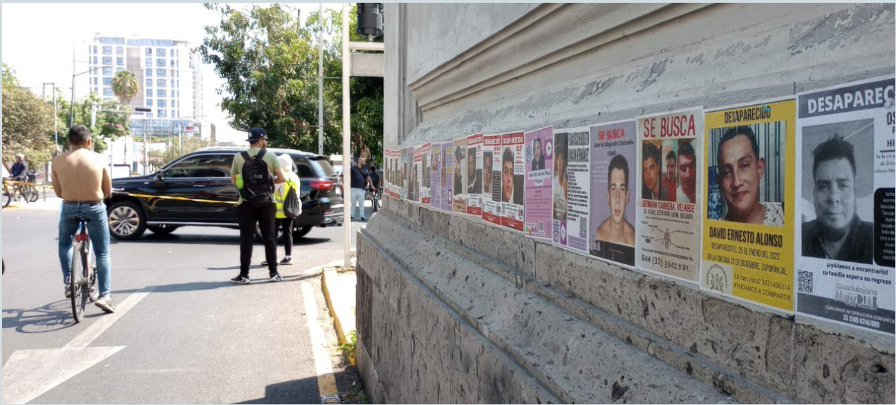
Foto 13. Además de antesala, el interior de los arcos se convierte en un espacio de protesta, en una galería del no olvido de las centenas de personas desaparecidas en el AMG y en todo Jalisco. Fotografía: Luis Adolfo Ortega Granados, 2023.