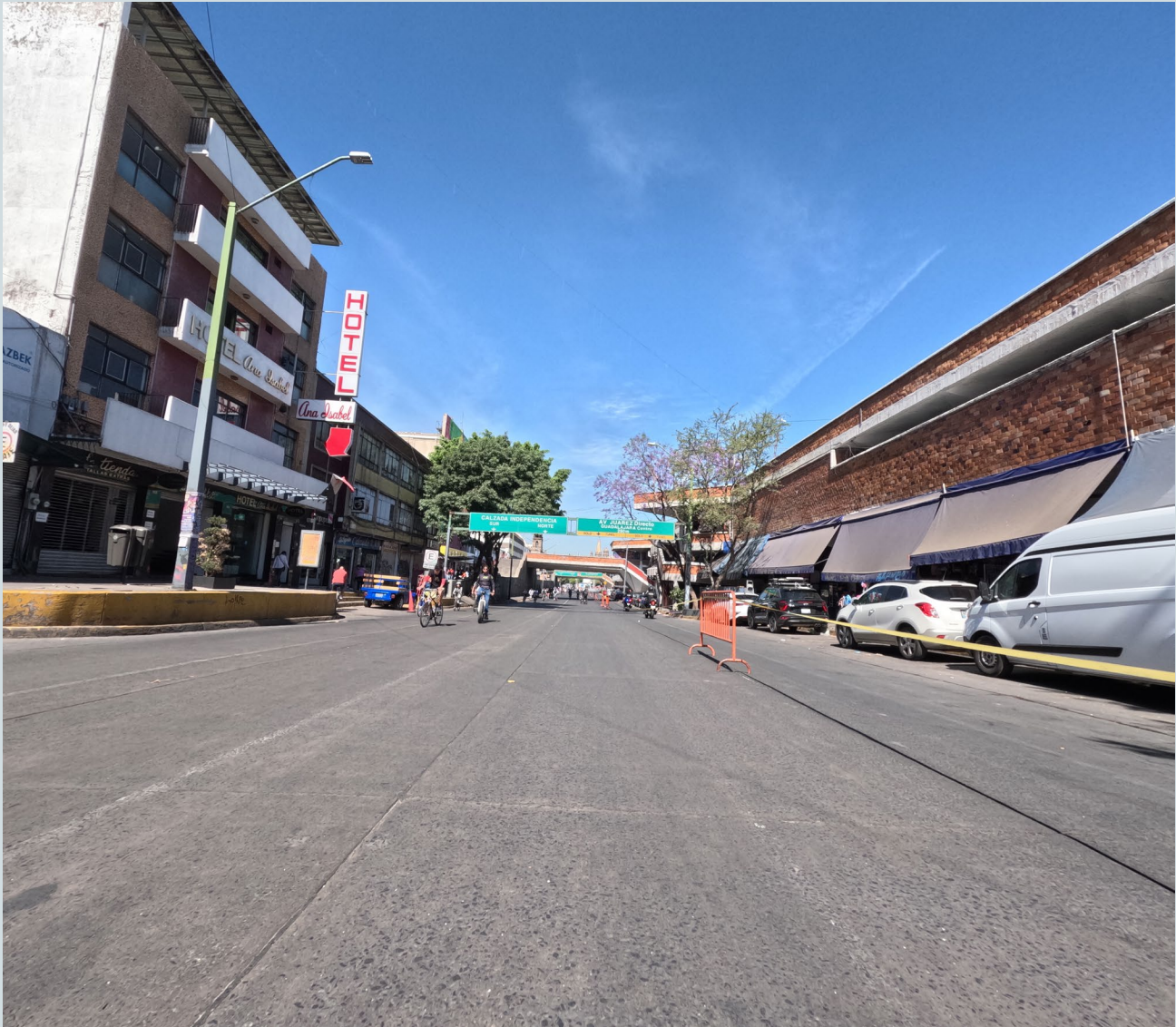
Foto 5. El mercado San Juan de Dios (a la derecha), como nodo de diferenciación social, anuncia el pronto arribo a la calzada Independencia.