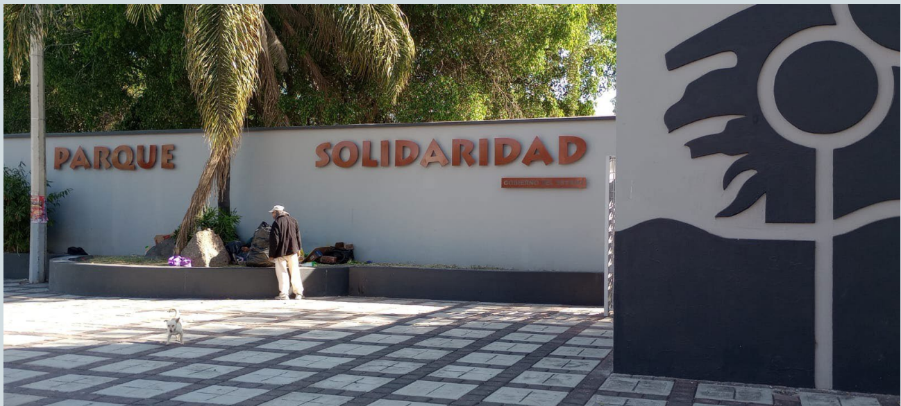
Foto 1. El inicio de la ruta comienza cerca del parque Solidaridad, en donde la vida callejera marca el paisaje urbano. Fotografía: Luis Adolfo Ortega Granados, 2023.