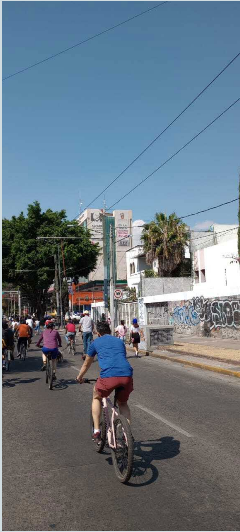
Foto 10. Los edificios del fondo quedan como pilares de tensión política entre la Universidad de Guadalajara y el Gobierno de Jalisco.