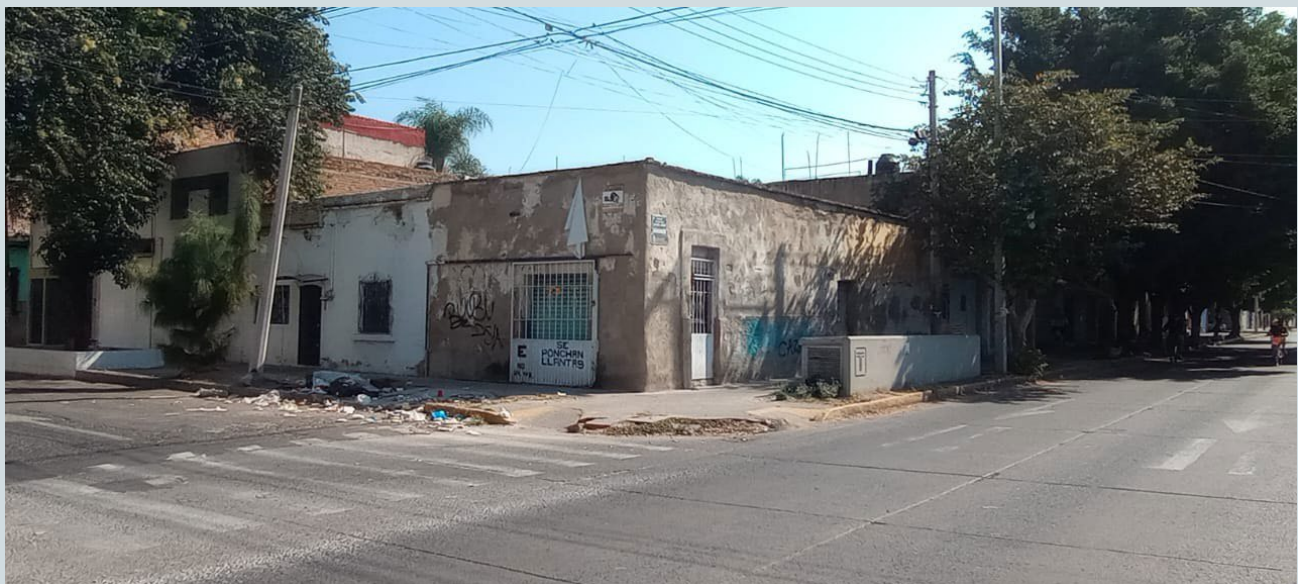
Foto 2. Durante el recorrido, las esquinas se convierten en el receptáculo frente a la ausencia de los recolectores de basura del municipio.