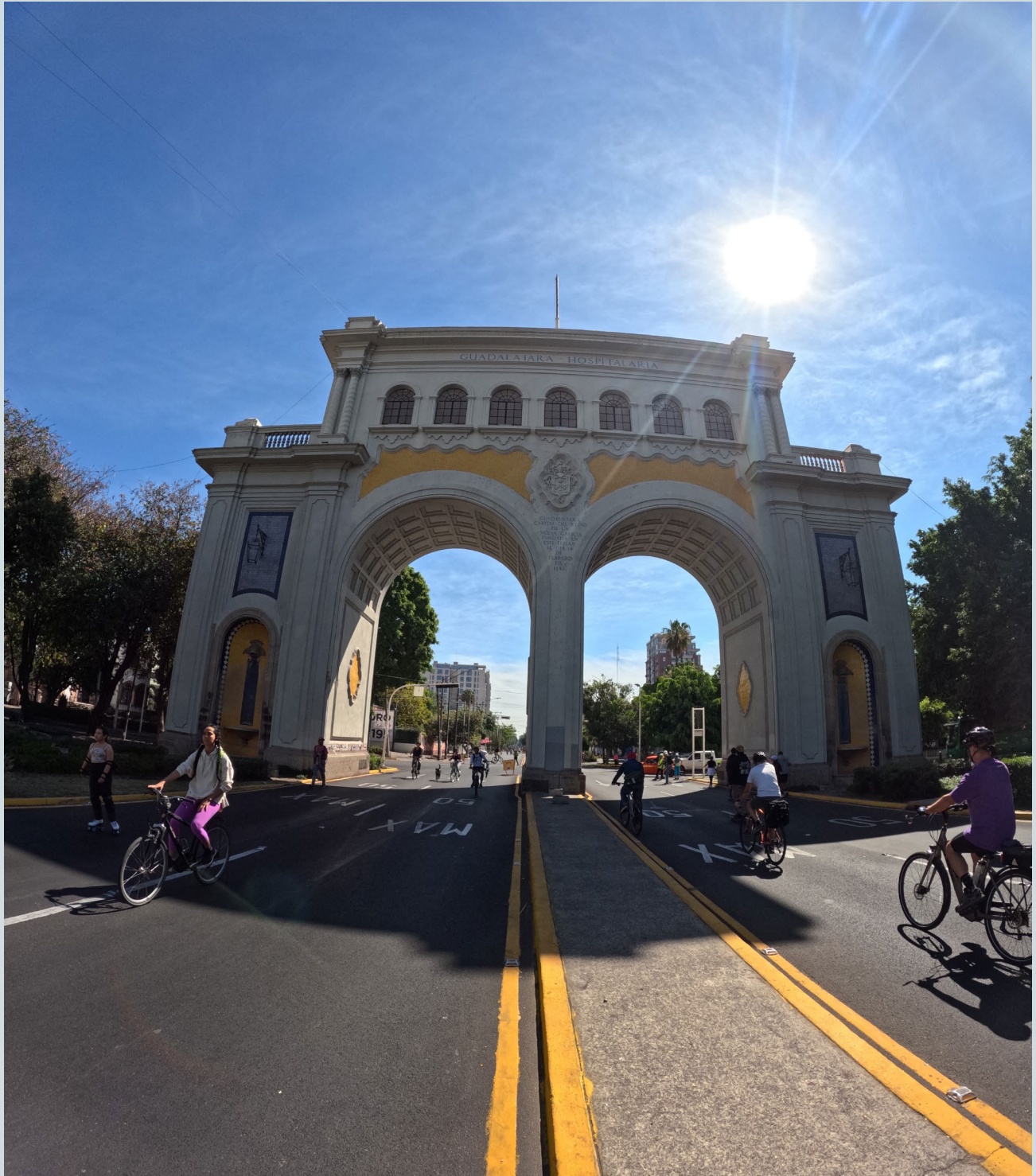
Foto 12. Este arco es la antesala de bienvenida para la Minerva. Fotografía: Luis Adolfo Ortega Granados, 2023.