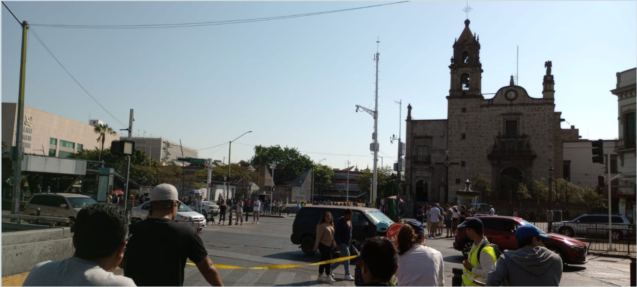
Foto 7. Otra toma entre la avenida Juárez y la calzada Independencia donde el templo católico aparece como testigo de lo que allí ocurre.