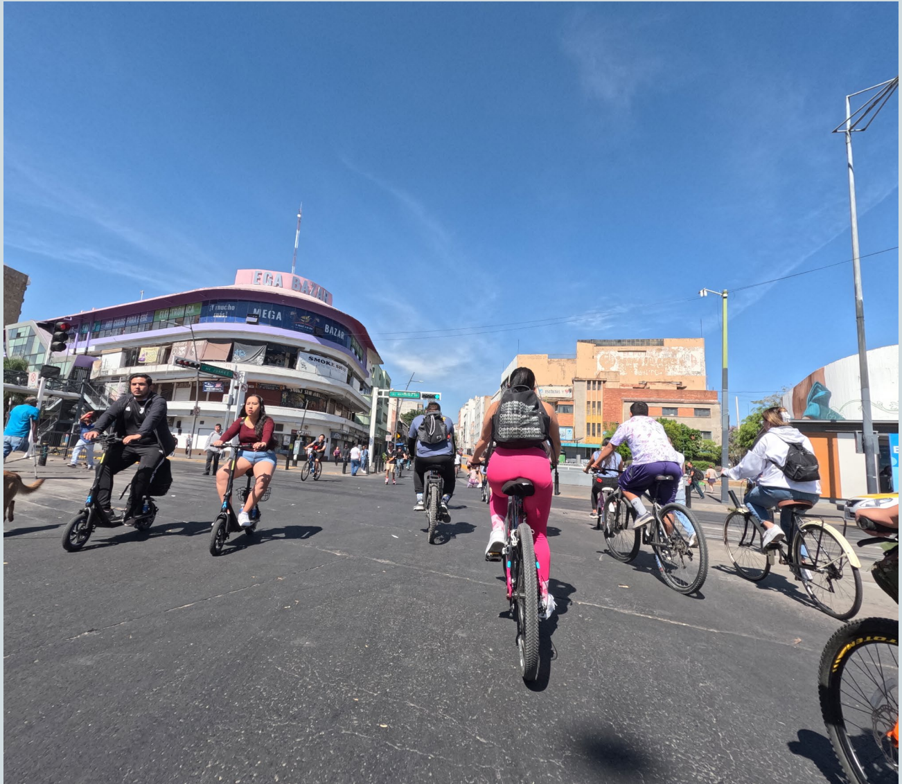
Foto 6. El cruce entre la avenida Juárez y la calzada Independencia anuncia la multimodalidad dominical entre las y los asistentes a la vía y el transporte público llamado Macrobús Independencia.