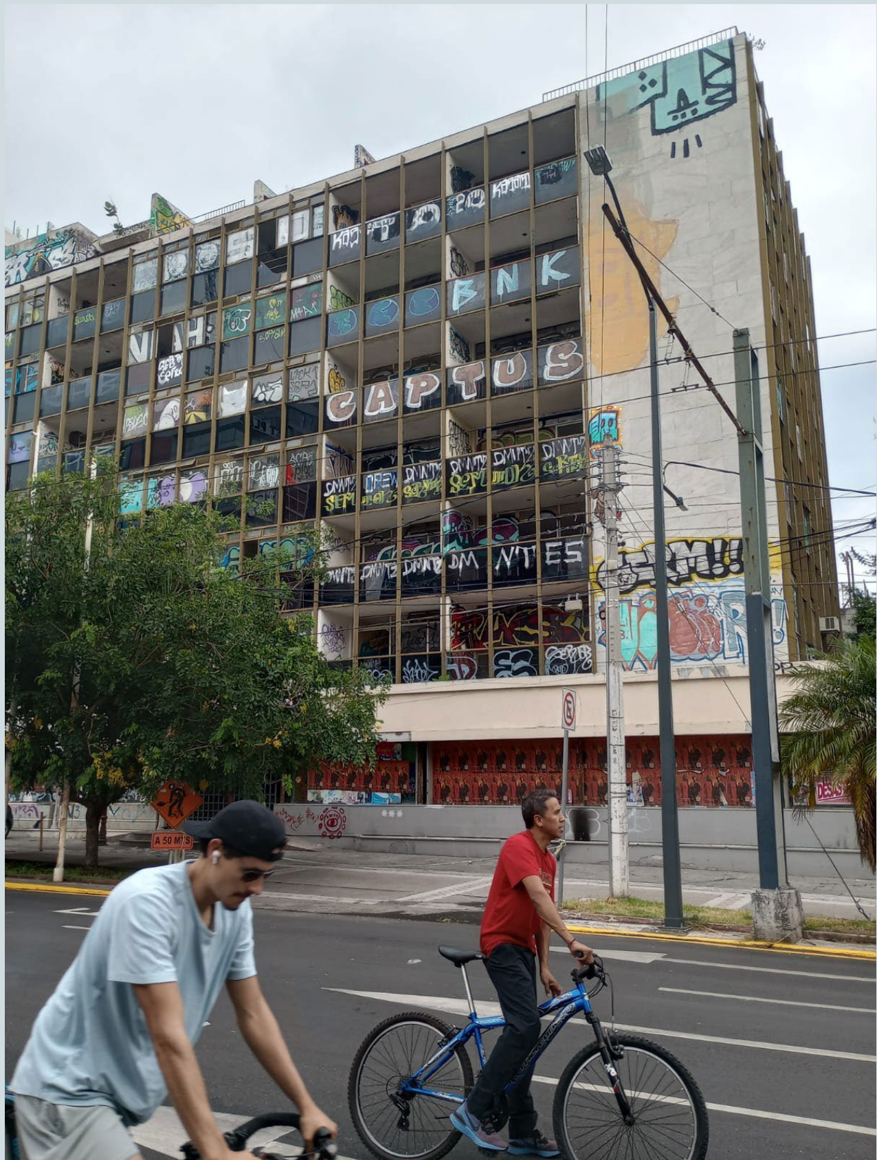
Foto 11. Este tipo de edificios desocupados deja a la vista las otras formas de habitar desde el arte urbano. Fotografía: Luis Adolfo Ortega Granados, 2023.