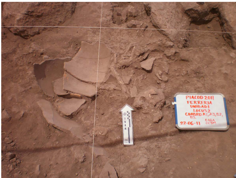
FIGURA 5. Entierro secundario, posiblemente en urna, afectado por la erosión. Casa 2, La Ferrería.

rra batida y se generó una especie de cista o “cuna de piedra” en donde se pusieron los restos mortales, pero no había tapa o piedras por encima (Vidal Aldana et al. , 2023). Así, es difícil considerar a estos como entierros indirectos, pero también es cierto que la deposición implicó más que solo la excavación de la oquedad para colocar dichos restos.