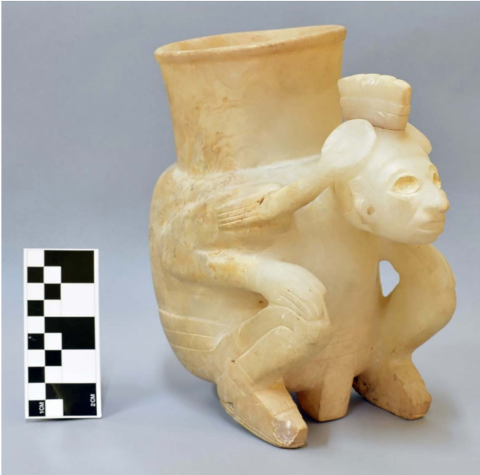
FIGURA 11. Vaso de alabastro con efigie antropomorfa.

Todos estos datos se cruzan: vasos, posición sedente, reutilización de huesos humanos y momificaciones o bultos funerarios. Si bien a primera vista se antojan aislados, cuando se los entreteje permiten entender la existencia de ciertos contextos mortuorios dentro de conjuntos más amplios, en este caso de los estados de Sinaloa y Durango. Así, por un lado, se puede comprender la presencia de vasos y ollas (con intrincada iconografía) a manera de objetos asociados como viáticos para el otro mundo, concebido como lugar de festividades y desenfreno; y por el otro, los contextos con fragmentos de cuerpos articulados como huellas de posibles prácticas de entierros secundarios asociados a bultos mortuorios y tradiciones de comunicación con los ancestros.