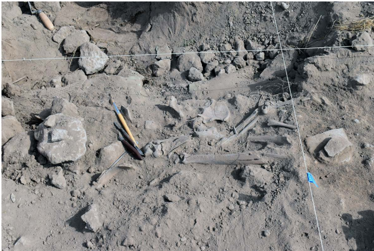
FIGURA 8. Inhumación registrada durante las excavaciones de 2023 en La Ferrería.

una especie de guerras floridas que este pueblo tenía con los xiximes (González Rodríguez, 1980). Dichas guerras implicaban la captura de enemigos, o la toma de cabezas para conservar los cráneos. En el caso de obtener un cautivo, se le sacrificaba y se conservaban los huesos, que se colocaban en una casa en particular. Esto implica que existían prácticas culturales en las cuales los huesos cobraban una importancia medular, en este caso asociada a la fertilidad de la tierra.