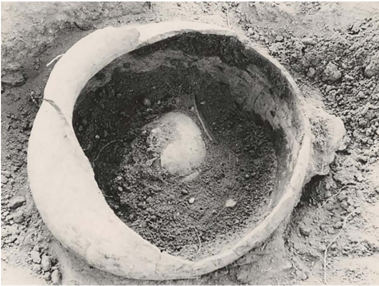
FIGURA 4. Cráneo al interior de urna funeraria, excavada por Charles Kelly en los años cincuenta.

Sinaloa, en La Ferrería son muy escasas y parecen haber contenido solamente a un individuo (Punzo Díaz et al. , 2011). Además, hay un posible entierro indirecto de difícil interpretación, se trata de un cuarto dentro de la estructura conocida como Casa Colorada, que en su interior únicamente contenía huesos de varios cuerpos. Así, se trata de una edificación preparada específicamente para la colocación de huesos, muy parecida a una cista, pero a falta de los datos de excavación no está claro si responde a una sola actividad o si fue un espacio constantemente utilizado y reutilizado como osario (Kelley, 1954a, 1954b).