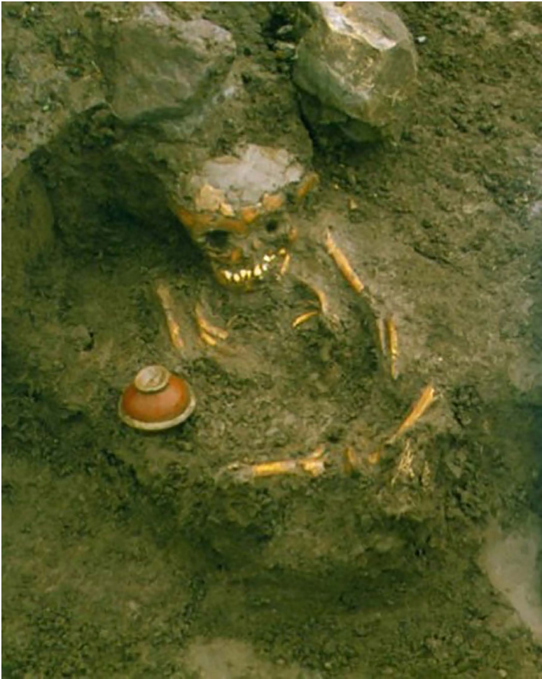
FIGURA 3. Inhumación de infante en San Miguel La Atarjea.