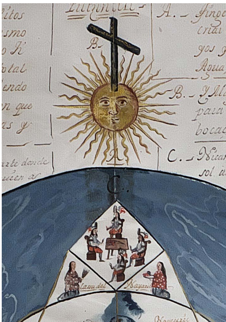
FIGURA 9. Fragmento de la ilustración que acompañaba al informe de Arias de Saavedra. Se puede ver a las dos sacerdotisas y los cuatro bultos mortuorios.