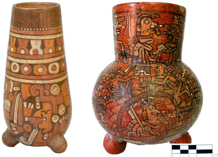
FIGURA 6. Izquierda: ejemplo de vaso piriforme del Museo Arqueológico de Mazatlán. Fotografía de Emmanuel Gómez. Derecha: olla globular proveniente de San Felipe Aztatán, Nayarit. Tomada de Garduño Ambriz (2013:10).

lugar toman “agua de peyote”, que les ayuda a resistir durante sus fiestas (Neurath, 2002). Pero según la creencia del camino de los muertos de los mismos wixarika, en el espacio asignado para ellos se celebran fiestas desenfrenadas en donde los difuntos bailan y cantan, y una versión de este mito asegura que se encuentran en estado alterado debido a que ciertos dioses les dan una bebida alcohólica que les hace creer que están vivos y que se encuentran en las que fueron sus casas (Leal Carretero, 1992).