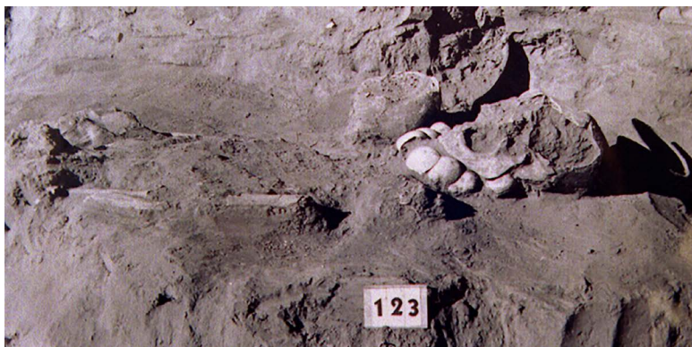
FIGURA 2. Entierro extendido en el sitio El Ombligo.

Ekholm pudo determinar ciertas diferencias estratigráficas. Así, los entierros más profundos eran todos directos y estaban orientados con la cabeza hacia el sur, excepto uno hacia el oeste; mientras que en los niveles superiores los entierros directos fueron orientados mayoritariamente con la cabeza hacia el norte y solo tres hacia el oeste. Casi todas las urnas estaban en las zonas superficiales, pero los entierros de bulto se encontraron a lo largo de los casi tres metros de profundidad (Carpenter, 2008:157-160; Ekholm, 2008:17-18).