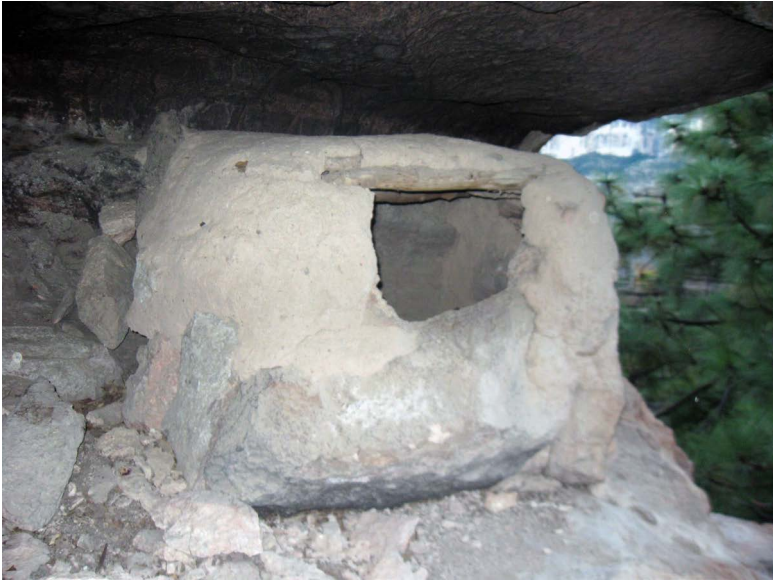
FIGURA 10. Estructura mortuoria en forma de cocedero, en la sierra de San Dimas, Durango.

Se retoman todos estos datos porque implican aceptar que: 1) los pueblos que habitaron La Ferrería conocían, practicaban y daban importancia a la elaboración de bultos mortuorios y a la posición sedente de sus muertos; 2) realizaban exhumaciones o remociones de contextos o huesos para colocarlos en otros lugares, o bien para renovar un espacio de importancia liminal. Pero sobre todo, 3) que los huesos tenían una envergadura simbólica más allá del mero tratamiento funerario del individuo, que se convierte en un objeto ritual con funciones sociales.