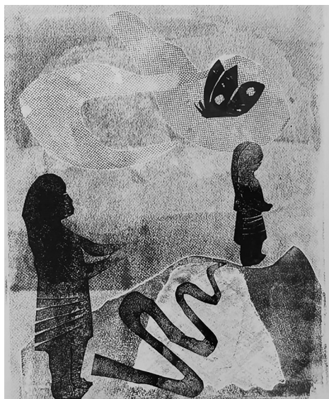
Figura 1. Autora: Ingrid Sáenz (2023). Técnica: monotipia, 27 × 21 cm.