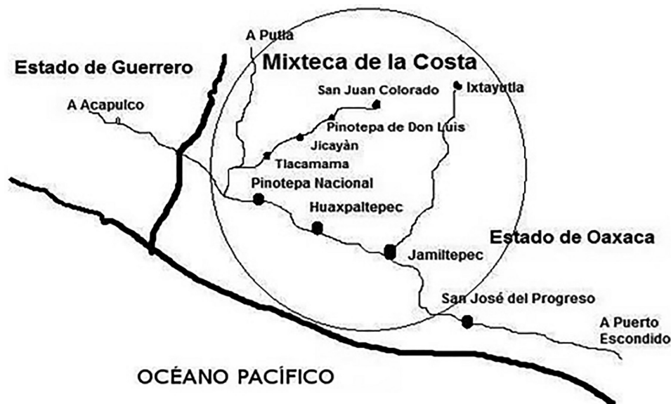
Figura 2. Mapa de la región Costa Chica, elaborado por Francisco Ziga (2013)

personas son indígenas mixteca 4 y el resto son mestizos. Como señalé anteriormente, el nombre indígena de la comunidad es Ndoó Yu'u o Ñuu Ndoó Yu'u.