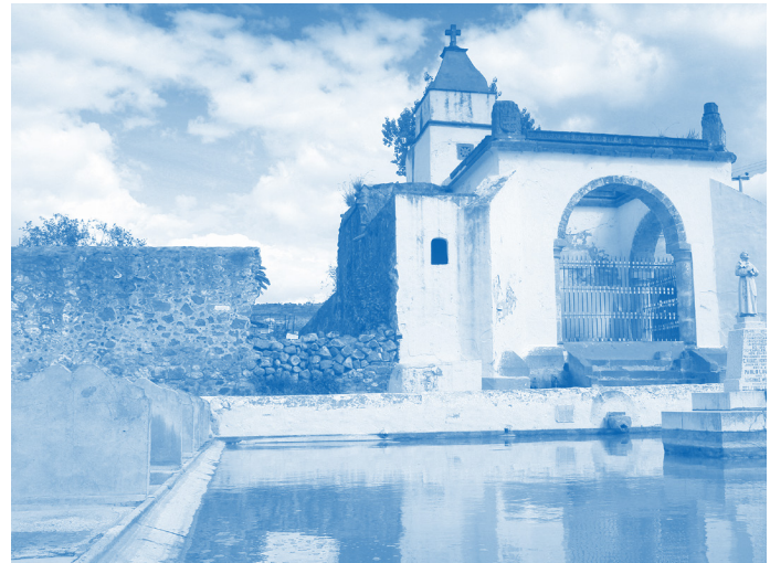
Caja de Agua, Tepeapulco Fotografía: Roberto Hernández, 2017

V entanilla Única es un servicio implementado por el Instituto Nacional de Antropología e Historia, y puesta a disposición de la ciudadanía para el ingreso de sus solicitudes de autorización relacionadas con obras, productos o actividades que involucren bienes del patrimonio cultural material de México. La Ley Federal sobre Monumentos y Zonas Arqueológicas, Artísticas e Históricas y su Reglamento, reconocen al INAH como el organismo competente del gobierno federal para preservar la herencia cultural de la nación y le otorga la facultad legal para extender las autorizaciones requeridas.