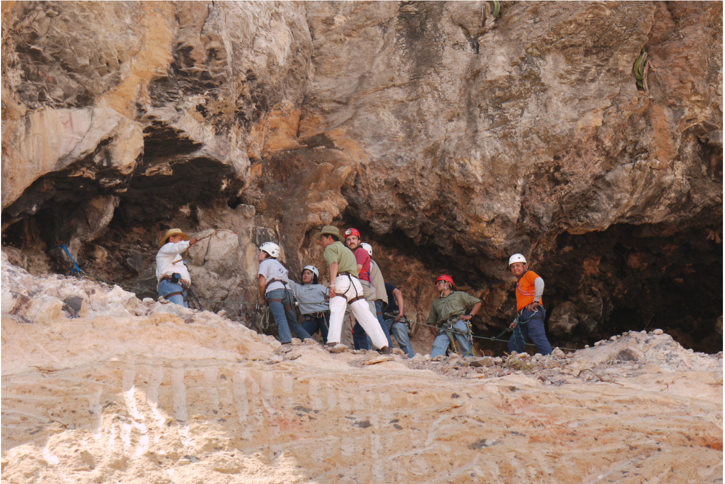
Fotografía de la inspección conjunta a las pinturas de El Yathé por el personal del Centro INAH Hidalgo y de la Coordinación Nacional de Conservación del INAH en mayo de 2009. Fotografía: Alfonso Torres, 2009.

Arq[lg]o. Alfonso Torres Rodríguez Mtro. Carlos Alberto Arriaga Mejía Centro INAH Hidalgo