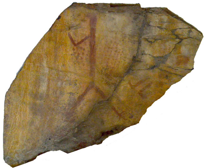
El hombre del Yathé, recuperado en la presa El Yathé.

y antropomorfas, distribuidas sobre todo en los conjuntos 1-a y 2, ambos separados entre sí por tres metros de distancia en un eje sur-norte y ubicados a la misma altura general. En el conjunto 1-b se logró apreciar algunas manchas en color rojo, pero sin diseño definido; debido al estado de conservación de la pintura esta se logra apreciar en menor medida. Los tres conjuntos fueron extraídos de su matriz rocosa, tratados en laboratorio para su limpieza y conservación y posteriormente fueron colocados sobre una base que facilitara su manejo. Actualmente los tres conjuntos se localizan en las bodegas del INAH en Hidalgo.