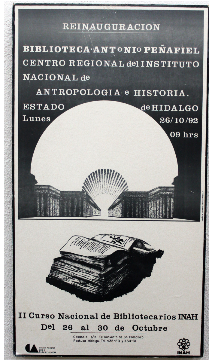
Cartel relativo a la reinauguración de la Biblioteca Antonio Peñafiel del Centro INAH Hidalgo en el marco del II Curso Nacional de Bibliotecarios del INAH celebrado del 26 al 30 de octubre de 1992.

La biblioteca Antonio Peñafiel del INAH Hidalgo, fue inaugurada en 1985 y su establecimiento era parte del proyecto de recuperación de los espacios del exconvento franciscano que aún se encontraban en ruinas; con su nombre se recuerda y se