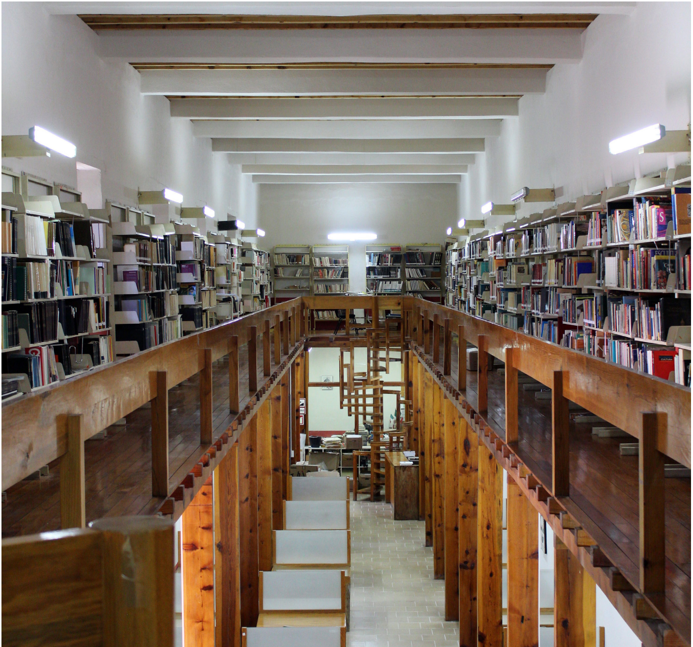
Biblioteca Antonio Peñafiel, imagen tomada en los días inmediatos a la terminación de la restitución de la techumbre. 2021

der la biblioteca Antonio Peñafiel del Centro INAH Hidalgo. Parte de su experiencia como bibliotecaria nos la comparte con la