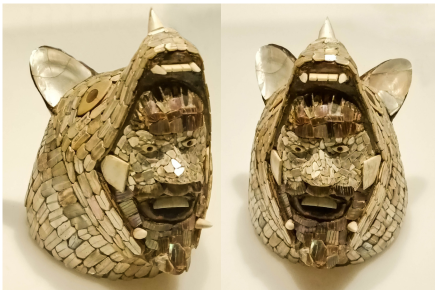
Guerrero Coyote.

www.inah.gob.mx/zonas/80-zona-arqueologica-y-museo-de-sitio-de-tula