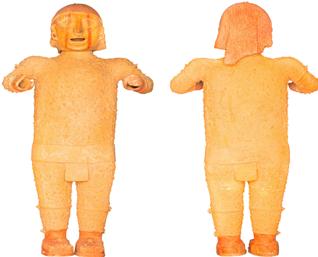
Escultura de Xipe Tótec descubierta en diciembre de 2007.

Estas figurillas, en ocasiones, se han descubierto asociadas con entierros infantiles, los cuales se han interpretado como ofrendas a los dioses de la renovación de la tierra.