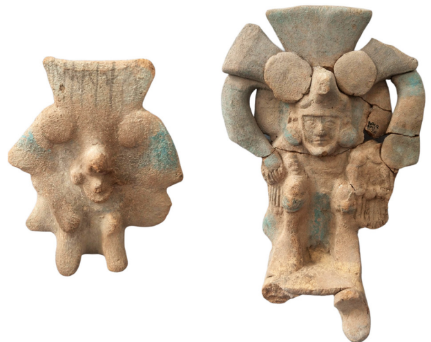
Figurillas asociadas a Xipe Tótec

En la periferia de la ciudad, en los barrios adyacentes, probablemente se realizaba el culto a Xipe Tótec, ya que se han descubierto figurillas que representan guerreros que portan la piel de un desollado; se observa claramente que las manos están cayendo a los costados de los yelmos y están ricamente adornados con plumas.