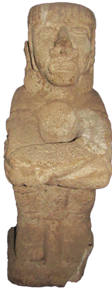
Portaestandarte recuperado en el Boulevard Tula- Iturbe que lleva la piel de un personaje desollado.

recuperarla, toda vez que fue extraída por la remoción de máquinas enfrente de un hotel que se encuentra por el puente Metlac.