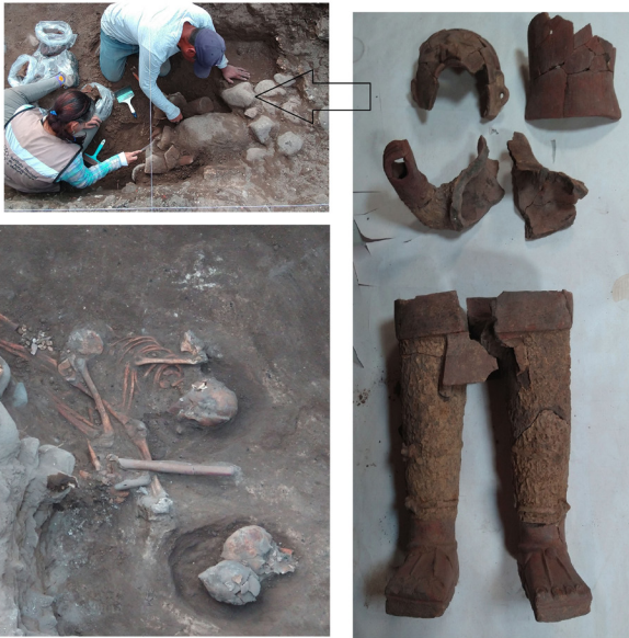
Nuevo hallazgo de una escultura de Xipe Tótec en el centro de la ciudad de Tula de Allende. Asociados a él se encontraron dos cráneos humanos, así como restos de dos individuos con evidencias de que fueron expuestos al fuego.

a la deidad que se le rendía culto localmente y que se trataba del dios Xipe Tótec.