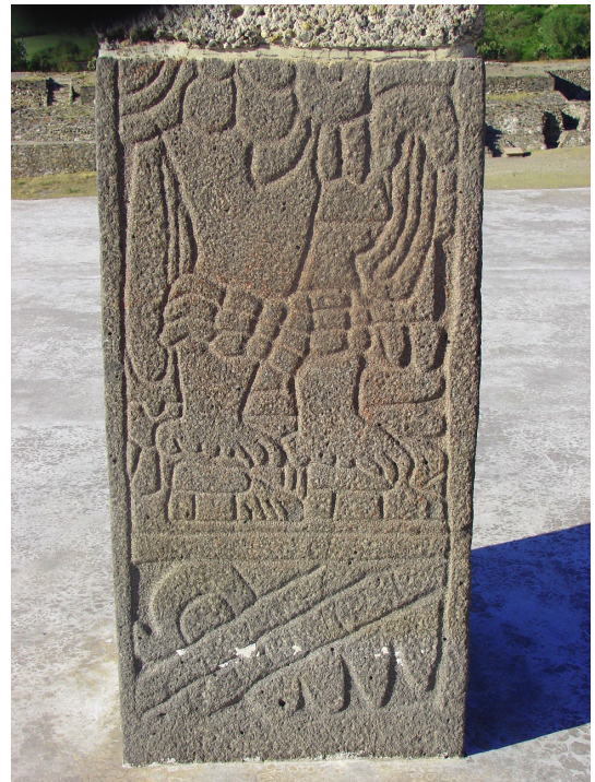
Pilastra con imagen a Xipe Tótec. Zona arqueológica de Tula

Otra referencia arqueológica sobre Xipe Tótec en Tula es la descubierta por Jorge R. Acosta al mismo tiempo del hallazgo de los Atlantes, se trata de la parte inferior de una pilastra donde se observa un personaje ataviado como guerrero tolteca; lleva en su mano derecha un cuchillo curvo, rodilleras y caclis. Este personaje lleva puesta una piel humana, de la cual, resaltan las extremidades inferiores del desollado;