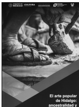
Libro El arte popular de Hidalgo