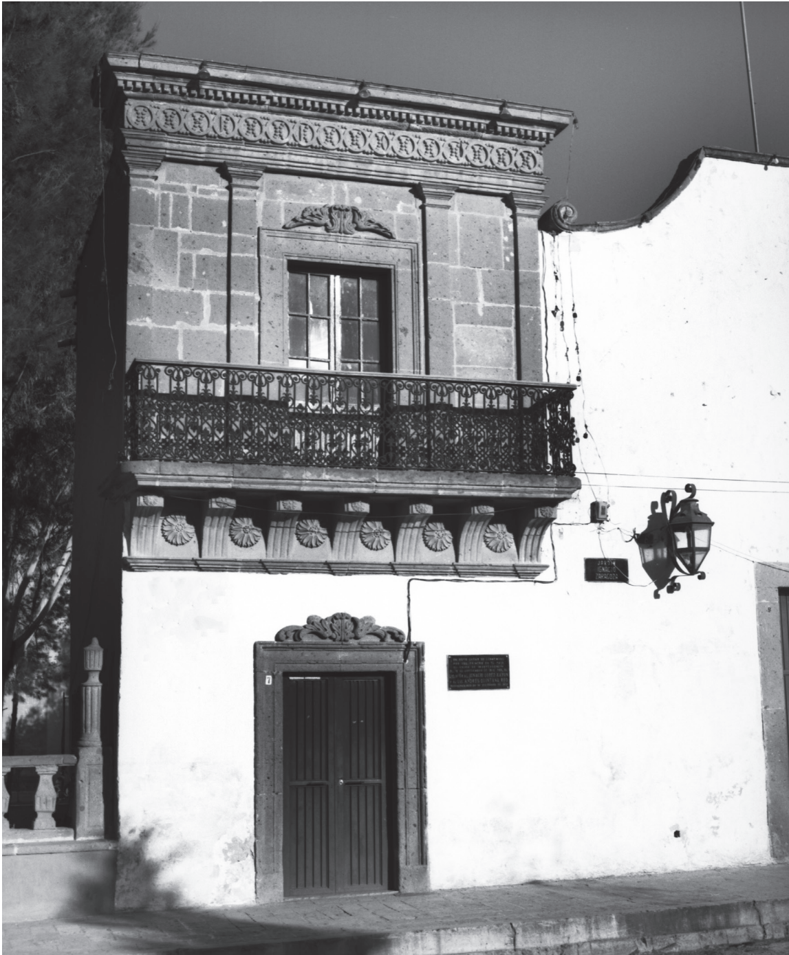
El Chapitel. Año 1991.

nivel sobre la planta original. En este sitio, el 16 de septiembre del año de 1812, tuvo lugar la primera conmemoración del “Grito de independencia” con motivo del segundo aniversario del “Grito de Dolores” por parte del general Ignacio Rayón como presidente de la Junta Gubernativa de Zitácuaro y del licenciado Andrés Quintana Roo.