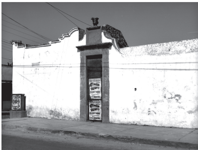
Edificio conocido como La Alberca. Año 1991.

El edificio de la Presidencia Municipal de Huichapan es un inmueble de arquitectura civil relevante del siglo XIX, construido por órdenes del coronel Francisco Limón, jefe político del distrito y del presidente municipal Florencio González, destinándose para ello la plazuela de frente a las Casas Reales y documentada en plano levantado por Manuel Esquivel en 1710. Las obras del inmueble iniciaron el 16 de septiembre de 1887 y fue inaugurado el 21 de abril de 1889. El acceso al edificio se hace a través de un portal cuyos arcos mixtilíneos de diseño similar a los arcos de las puertas de acceso del edificio parroquial de San Mateo. Su distribución se desarrolla en torno a un patio central rectangular con corredores perimetrales delimitados por columnas.