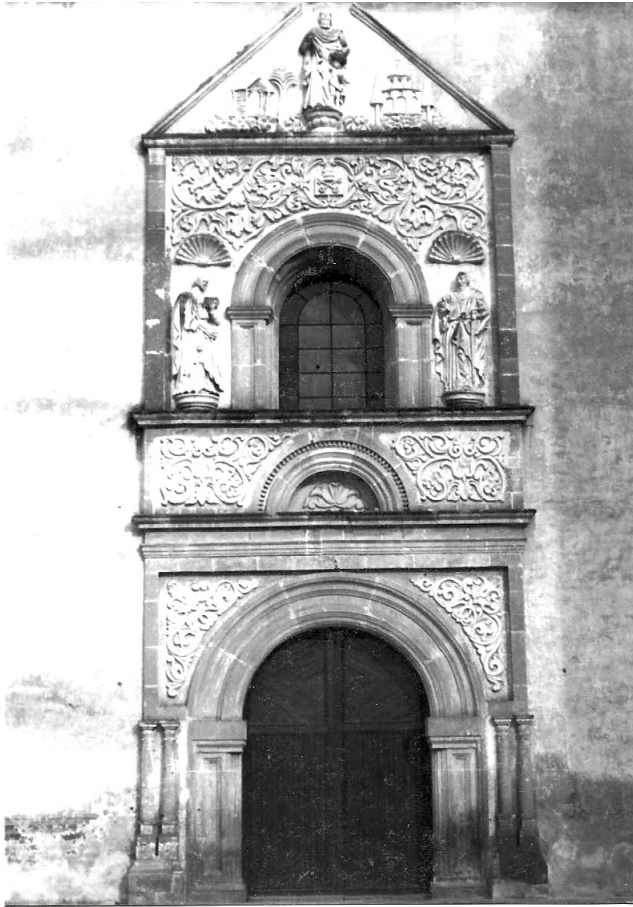
Portada de la capilla de Guadalupe. Año 1985.