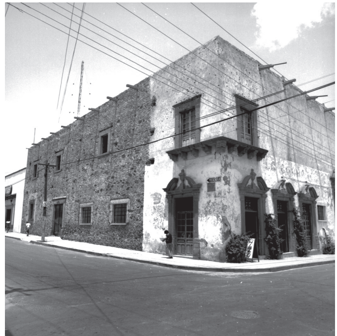
La Borrasca. Año 1991.

Antigua casa del diezmo, dado que en la época virreinal fue destinada para la recaudación, depósito y conservación de los diezmos recogidos por la iglesia. Probablemente se encontraba en construcción alrededor del año 1762, considerando la existencia de una inscripción localizada en una de las vigas del inmueble que lleva la fecha del 7 de febrero de ese año. Durante la Guerra de Reforma al edificio se le conoció con el nombre de “Casa de las palomas” y a inicios del siglo XX fue popularmente nombrado como “la Borrasca”, para referirse al tendajón instalado en la esquina, término con el que eran conocidas en la antigüedad las tiendas de abarrotes.