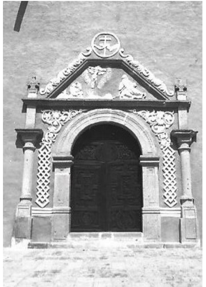
Portada lateral de la capilla de la Tercer Orden. Año 1991.

Su nombre hace alusión a la “Tercer orden”, fundada por el propio san Francisco de Asís, en la que ingresaban los devotos laicos que deseaban seguir la regla establecida por el propio fundador de la orden franciscana. Se presume su construcción entre los años 1745 y 1784. Cuenta con dos portadas con columnas salomónicas, elementos arquitectónicos que ponen en duda los años de construcción señalados con anterioridad dado que esta modalidad del barroco floreció entre mediados del siglo XVII y primeras décadas del XVI-II. Para situar la época de construcción de la capilla, también debe considerarse el retablo de su altar mayor, que presenta columnas estípites. Investigaciones recientes señalan como autor del retablo al maestro pintor Francisco Martínez quien comenzó su construcción a partir el año 1751, después de haberse concertado con los albaceas del capitán Manuel Gonzáles Ponce de León.