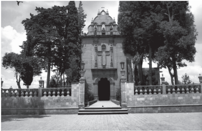
Capilla de El Calvario. Año 1991.

En cuanto a los monumentos de arquitectura civil, destacan: