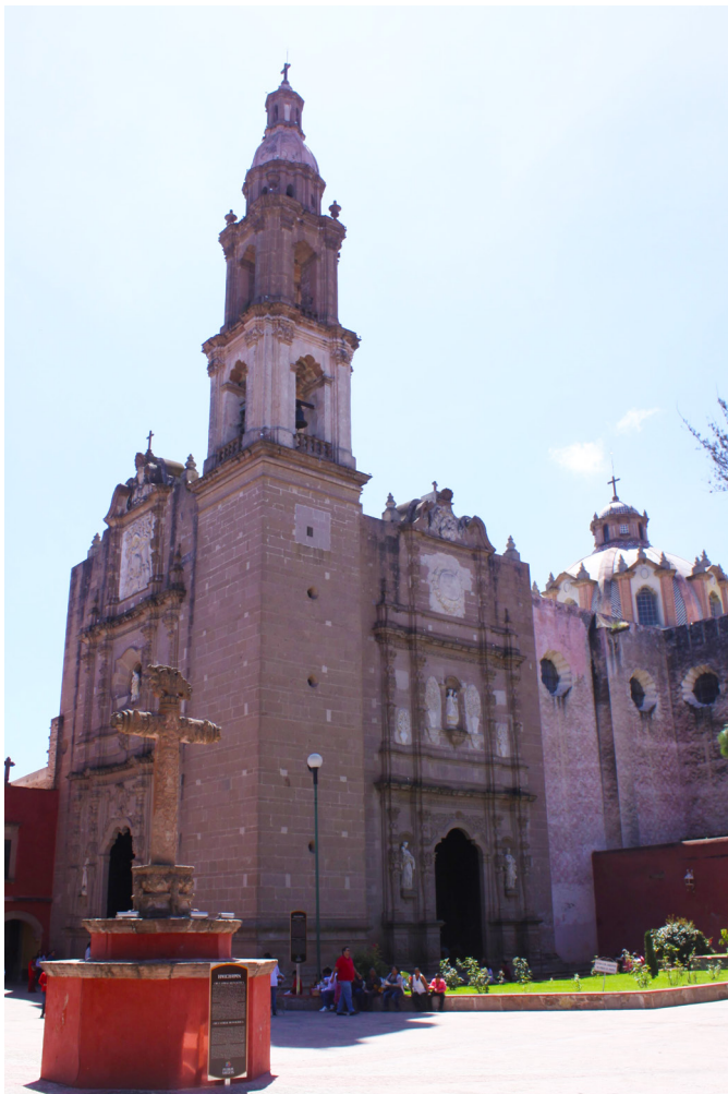
Parroquia de San Mateo Apóstol. Año 2019.

Huichapan presenta una traza reticular que data del siglo XVI, con presencia de una serie de monumentos históricos de carácter civil y de orden religioso; los religiosos destacan por su arquitectura monumental y artística y los civiles por su uniformidad pues tratase de construcciones de uno o dos niveles, con características tipológicas y de manufactura similares; ambos órdenes arquitectónicos son testimonio del proceso histórico del municipio, del estado y del país. Entre los monumentos históricos más representativos de Huichapan, mencionamos los siguientes: