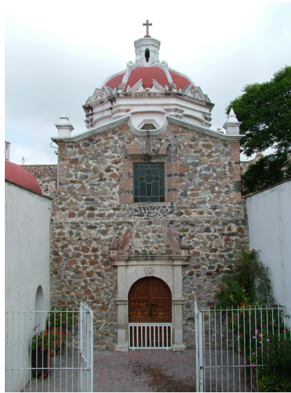
Fachada de la capilla de Nuestra Señora de la Luz. Arriba del frontón, en el paramento se aprecia el soporte de la viguería de la techumbre que cubría la antecapilla; año de 2017.