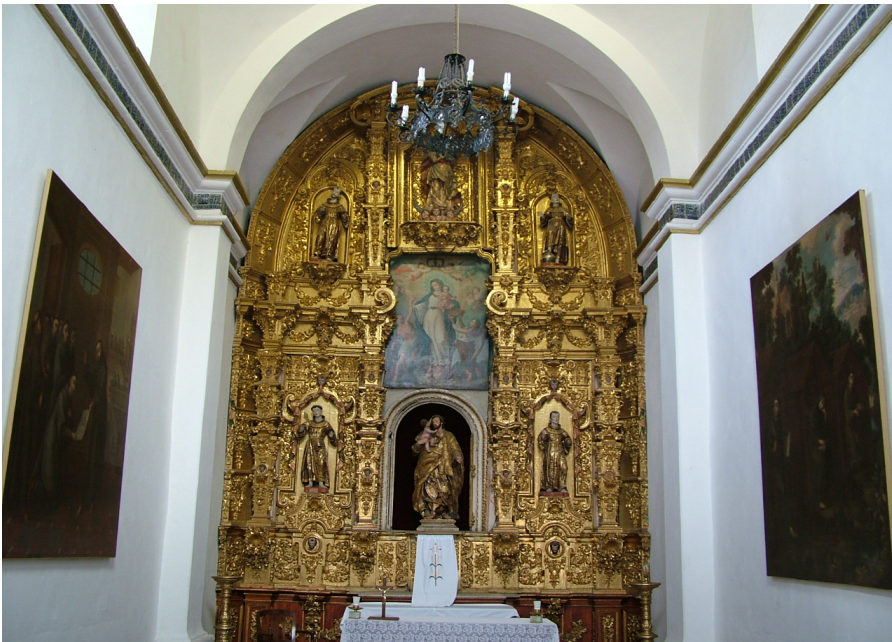
Retablo de la capilla de Nuestra Señora de la Luz, el otrora oratorio del noviciado del convento y colegio de San Francisco; ca. 2005.