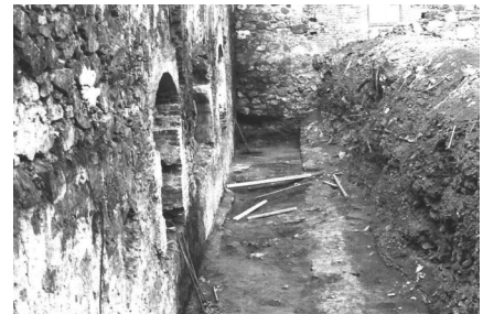
Trincheras realizadas para liberar tres bóvedas; durante la excavación aparecieron vestigios de muros y pisos de loseta de barro, elementos arquitectónicos posiblemente del noviciado; año de 1984.

bargo, años después se derrumbó o fue demolida. Durante los trabajos de reconstrucción del edificio realizadas entre 1983 y 1984, se abrieron dos trincheras para ventilar y erradicar humedades. Estas obras permitieron encontrar los vestigios arquitectónicos del noviciado: cimientos, fragmentos de muros con rasgos de pintura roja; restos de pisos de losetas de barro, un canal bruñido de cal tezontle y cubierto con losetas de piedra, así como una secuencia de vanos tapiados; en el escombro de relleno se hallaron pedazos de tela, de ladrillo, y ramas vegetales, etc., indicio de que el escombro se ocupó para nivelar el terreno.