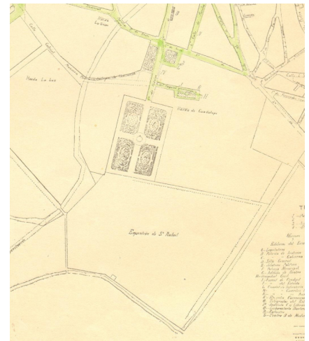
Detalle de un plano de Pachuca levantado en 1907 por disposición del presidente municipal Alfonso M. Brito. Se aprecia que el futuro parque Porfirio Díaz con su configuración rectangular actual.

de la huerta por no haber concretado la construcción del paseo público. Fue entonces que el ejecutivo estatal inició ante el gobierno federal los trámites correspondientes para recuperarlo y tomar en sus manos el fallido proyecto del ayuntamiento. La petición fue concedida alrededor del año 1899, con la condición de realizarlo en el término de dos años, so pena de cancelar la cesión del predio. Sin embargo, las obras no comenzaron de inmediato y el ejecutivo estatal solicitó prórrogas en repetidas ocasiones, argumentando carecer de los recursos económicos necesarios para la obra. Carecemos de información acerca de obras realizadas en el predio de la huerta durante los primeros años del siglo XX, obras que configuraron el diseño que logra apreciarse en el plano de Pachuca del año 1907, diseño muy diferente al que se observa en el plano de 1892. En este plano de 1907, levantado durante la presidencia municipal de Alfonso N. Brito, el parque tenía una configuración rectangular con eje norte sur y delimitado por bardas; se observan calles en sus cuatro costados, así como calzadas que le dividen en cuatro cuadrantes de jardín atravesados por andadores, con un diseño muy semejante al que actualmente tiene. Hay que anotar que el parque aparece sin nombre.