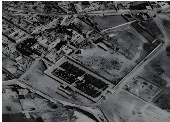
Fotografía área de Pachuca, captada entre 1926 y 1930. En la imagen se aprecian las bardas que circundaban el terreno rectangular del Parque Hidalgo.

Seguramente el cambio de nombre del parque, trajo aparejado la colocación de los monumentos escultóricos dedicados a doña Josefa Ortiz de Domínguez y el de don Miguel Hidalgo y Costilla, dos bustos de bronce colocados sobre pedestales metálicos, fundidos en la pachuqueña Fundación Artística de Norberto Aranzabal. El monumento a Miguel Hidalgo quedó colocado al inicio de la calzada del parque, con