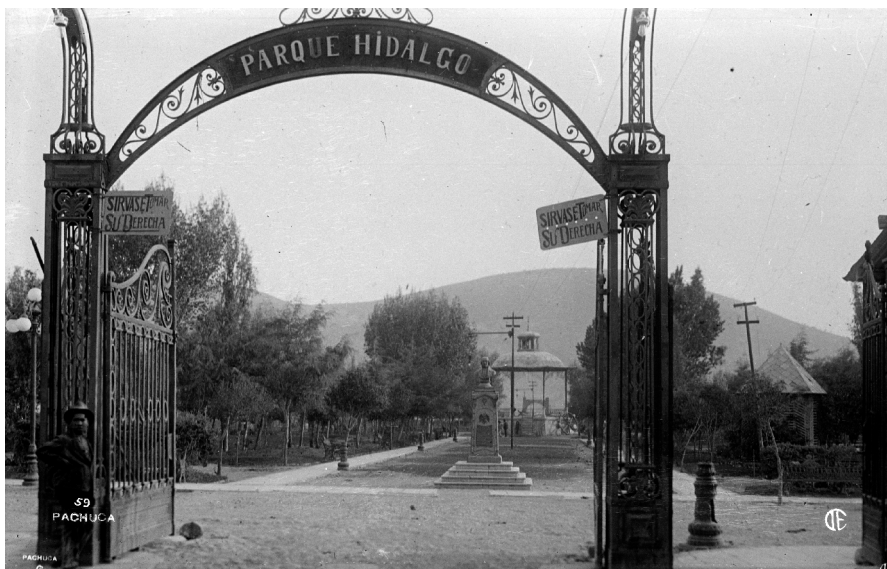
Entrada al Parque Hidalgo con su reja y el monumento al Padre de la Patria erigido entre 1912 y 1915; ca. 1921. La fotografía es anterior al año 1921. INAH. SINAFO. FN. MX. Cat. 196402

El 12 de julio de 1859, el presidente Benito Juárez, en el puerto de Veracruz, promulgó la Ley de Nacionalización de los Bienes del Clero. Mediante esta ley, las propiedades de la iglesia católica pasaron a formar parte del patrimonio nacional, ya que se incorporaron a los bienes de la Nación. Al amparo de esta legislación el propio presidente Juárez, en 1861, acordó ceder al ayuntamiento de Pachuca el edificio del convento y colegio de San Francisco de Pachuca, para establecer un hospital, una cárcel y otras oficinas públicas; previamente ya otra sección del edificio había sido destinada a la Escuela Práctica de Minas. El acuerdo incluía ceder también los terrenos de la huerta y el potrero del colegio, para apoyar la iniciativa del Ayuntamiento de Pachuca de construir en ambos espacios un paseo público y un panteón; el acuerdo presidencial favorable fue notificado a Ramón Mancera de San Vicente, prefecto de Tulancingo, el 10 de marzo de ese año de 1861, por parte de Guillermo Prieto, ministro de Hacienda en ese momento. El propósito de esta breve nota, es ofrecer algo de información de cómo con los años, la huerta y una fracción del potrero se transformaron en el hoy Parque Hidalgo.