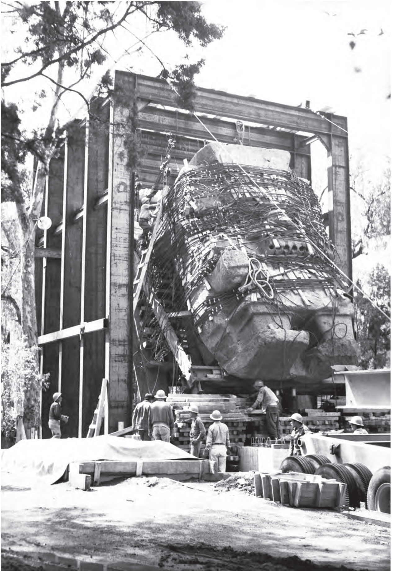
Colocación de Tláloc en el Museo Nacional de Antropología