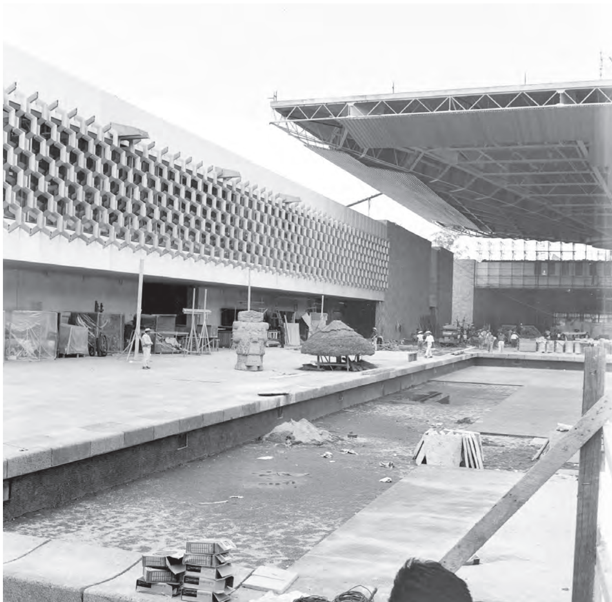
Coatlícue durante la construcción del Museo Nacional de Antropología

Más o menos a finales de abril de 1963 el proyecto arquitectónico estaba concluido en su totalidad y ya se