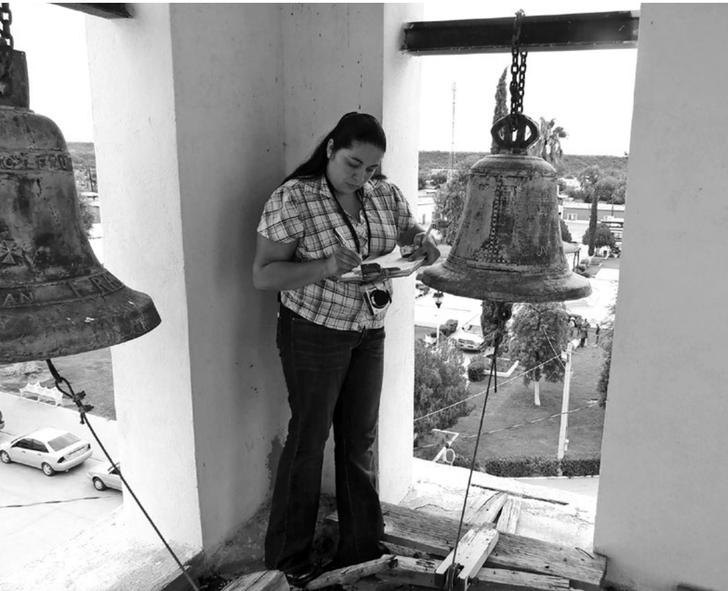
REGISTRO DE BIENES MUEBLES HISTÓRICOS EN EL TEMPLO DE NUESTRA SEÑORA DEL ROSARIO DE MOCTEZUMA, SONORA (2013).

mana de Historia Económica del Norte de México, como un esfuerzo interinstitucional que incluyen a la Universidad de Sonora, la Asociación de Historia Económica del Norte de México y el Centro INAH Sonora.