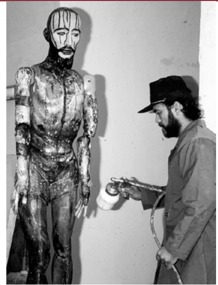
RESTAURACIÓN DE LA ESCULTURA DE MADERA DE ECCE HOMO SIGLO XVIII DEL TEMPLO DE NUESTRA SEÑORA DE LA ASUNCIÓN DE OPODEPE, SONORA.