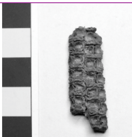
Tipo Zea mays