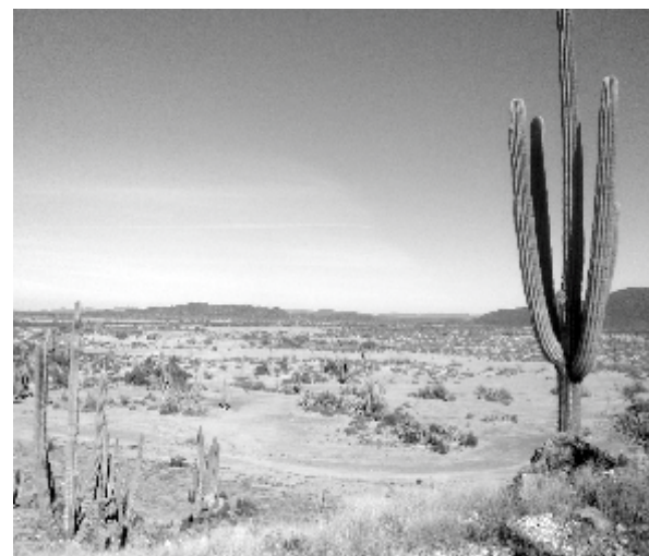
VISTA DEL SITIO EL GRAMAL.

Villalpando, Elisa y Aguilar, Alejandro. 2013. "Del mundo prehispánico y la etnohistoria en el Noroeste", en: Los Pueblos Indígenas del Noroeste. Atlas Etnográfico , Instituto Sonorense de Cultura. Hermosillo, Sonora, pp. 55-95.