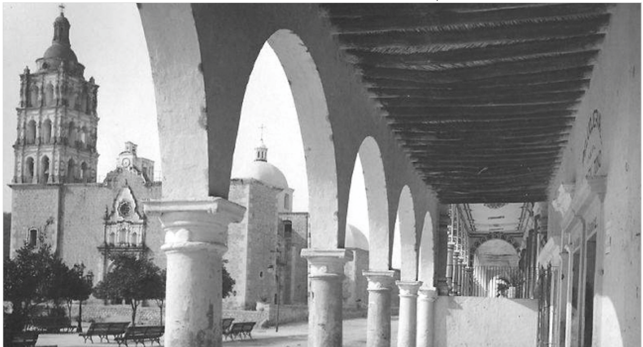
Portales del centro histórico de Álamos, Sonora.

Los mapas históricos muestran la larga permanencia en el tiempo de dicho camino, que sirvió para fortalecer vínculos entre los pobladores de ambos asentamientos desde el siglo XVII hasta mediados del XX. El Fuerte (fundado primero como villa y en 1610 como un asentamiento de tipo militar) se convirtió en polo de atracción para los colonos por la seguridad que ofrecía.