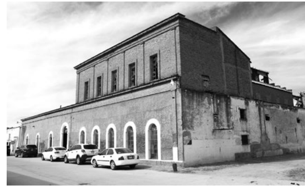
VISTA PRINCIPAL DEL MOLINO EL URENSE. 2018.

Cada vez toma más importancia a nivel mundial, en el ámbito de la arquitectura industrial, rescatar este tipo de inmuebles como patrimonio histórico y arquitectónico y devolverlos a la sociedad a través de proyectos sustentables y acordes a las necesidades actuales; para ello es importante contar con un programa de acción. Se planteó un proyecto integral en el que se considera que, una vez restaurado y rehabilitado el conjunto de 2,300 m 2 , se utilice como Casa Cultural de Ures que albergue diferentes usos sociales y sea una "edificación viva" tanto al interior como en su interacción con el entorno urbano.