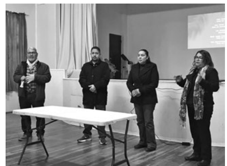
INSTRUCTORES: REST. JORGE ANDRÉS MORALES, ARQ. OMAR JARA DOMÍNGUEZ, HIST. ZULEMA BUJANDA E HIST. ESPERANZA DONJUAN ESPINOZA.