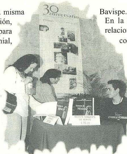
En el marco del 30 Aniversario del CENTRO INAH SONORA se presentó el número 14 de la revista Noroeste de México .

Como proyecto editorial, Noroeste de México es consciente de la necesidad de fortalecer un diálogo académico, científico y crítico que nos permita ayudar a construir un panorama distinto en nuestra sociedad y esa idea dio forma a la nueva edición en sus diferentes secciones. La que corresponde a arqueología presenta diversos trabajos sobre las investigaciones en sitios como Trincheras o La Playa, además de estudios especializados en distintos materiales analizados y en regiones como