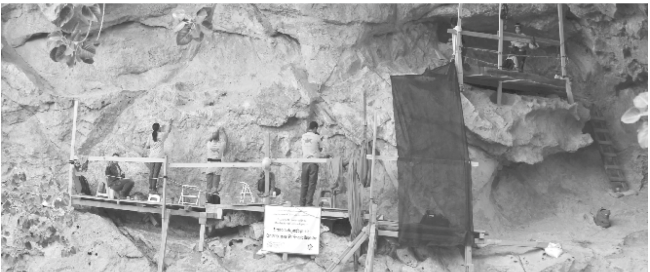
Trabajos en el panel principal de La Pintada.

Ubicado en el Municipio de Hermosillo este sitio arqueológico posee más de 2000 pinturas rupestres que se encuentran plasmadas a través de figuras zoomorfas: venados, reptiles y aves, pero también existen representaciones antropomorfas estilizadas, que conforman el pensamiento mágico religioso de los grupos que se asentaron temporalmente en el lugar.