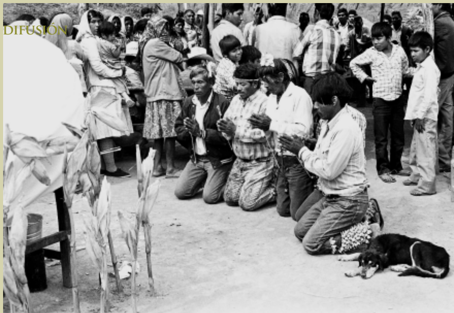
Bendición del maíz en el pueblo guarijío de Sonora.