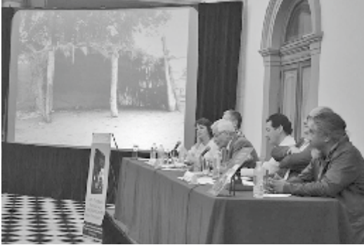
Aspectos de la presentación en El Júpate, Hutabampo, Sonora y en el Museo Nacional de Historia, Castillo de Chapultepec en México. A la izquierda, invitación de la presentación del libro en el Arizona State Museum.