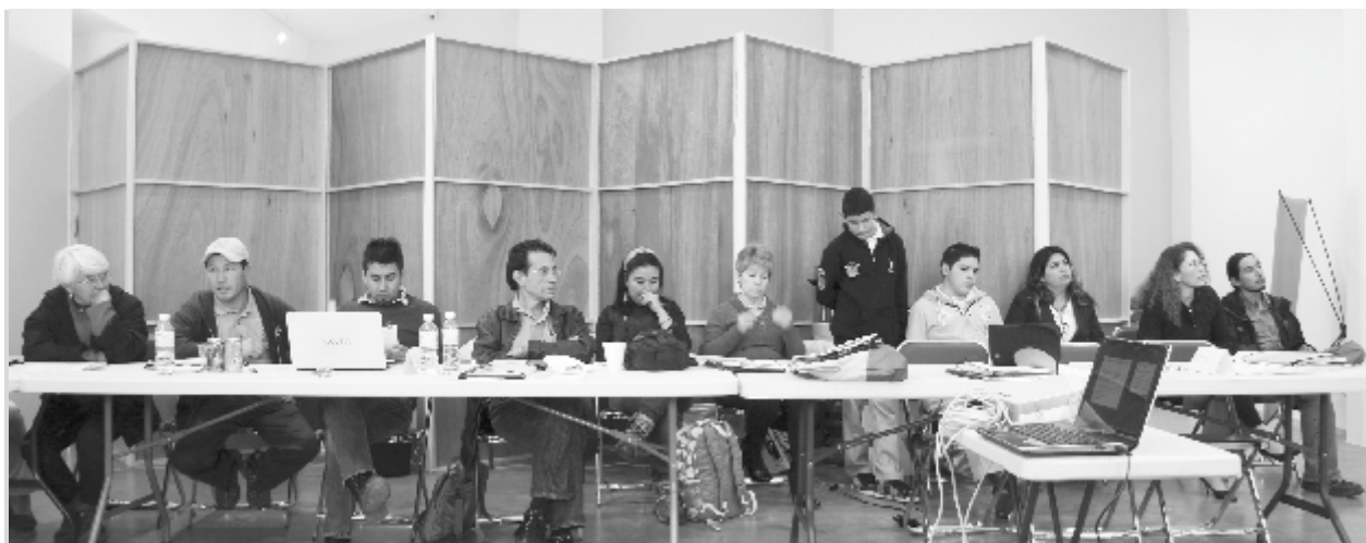
Aspectos generales del taller.