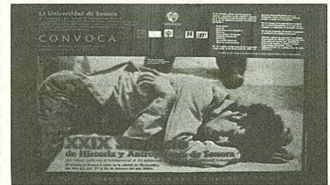
Poster Convocatoria Simposio de Historia