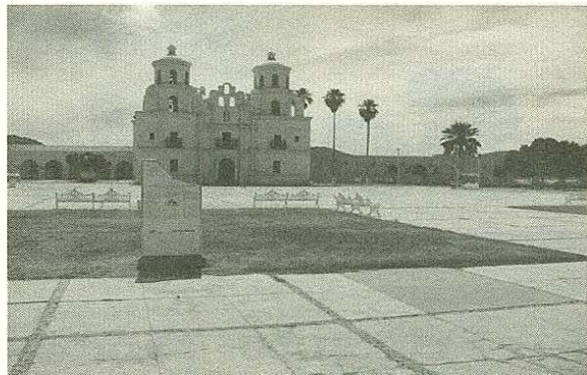
Cédula informativa en la Misión de Nuestra Señora de la Concepción de Caborca