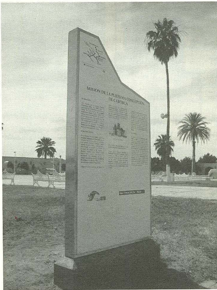
Cédula informativa en la Misión de la Purísima Concepción de Caborca

Se busca con ello dar a conocer a los miembros de cada una de estas comunidades, así como a visitantes y