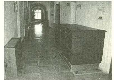
Baúl de madera en los pasillos del Museo de Sonora