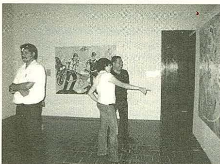
Público admirando obra ganadora, modalidad pintura "Flop" Acrílico sobre lino.

Las Salas Temporales del Museo de Sonora alojan la exposición "Artistas Premiadados de la VI Bienal de Monterrey FEMSA" , la cual está compuesta por 16 obras de 10 artistas en tres modalidades: pintura, escultura e instalación.