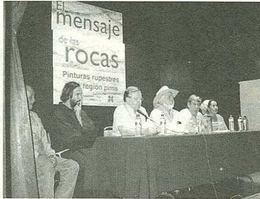
Presentación del libro: El mensaje de las rocas

La exposición, que fue inaugurada después de la presentación del libro, resume toda esta experiencia y presenta a través de fotografías el territorio y algunas de las tradiciones de los o'oba. Da cuenta además de los recorridos por los lugares donde se encuentran estos valiosos testimonios y de los diversos símbolos que expresan el pensamiento de nuestros