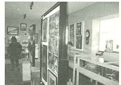
Interior del Museo "El Minero" en Sta. Bárbara, Chihuahua

toda nuestra historia y nuestras ganas de cuidar nuestro patrimonio ", haciendo referencia a que las piezas y objetos que se encuentran en exhibición son producto de donaciones, objetos en préstamo, en custodia, etc. por la misma comunidad.