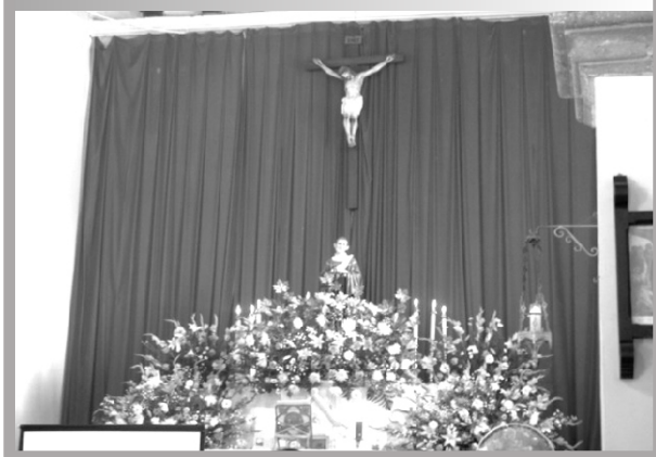
Altar del templo de San Lorenzo de Huépac, Sonora