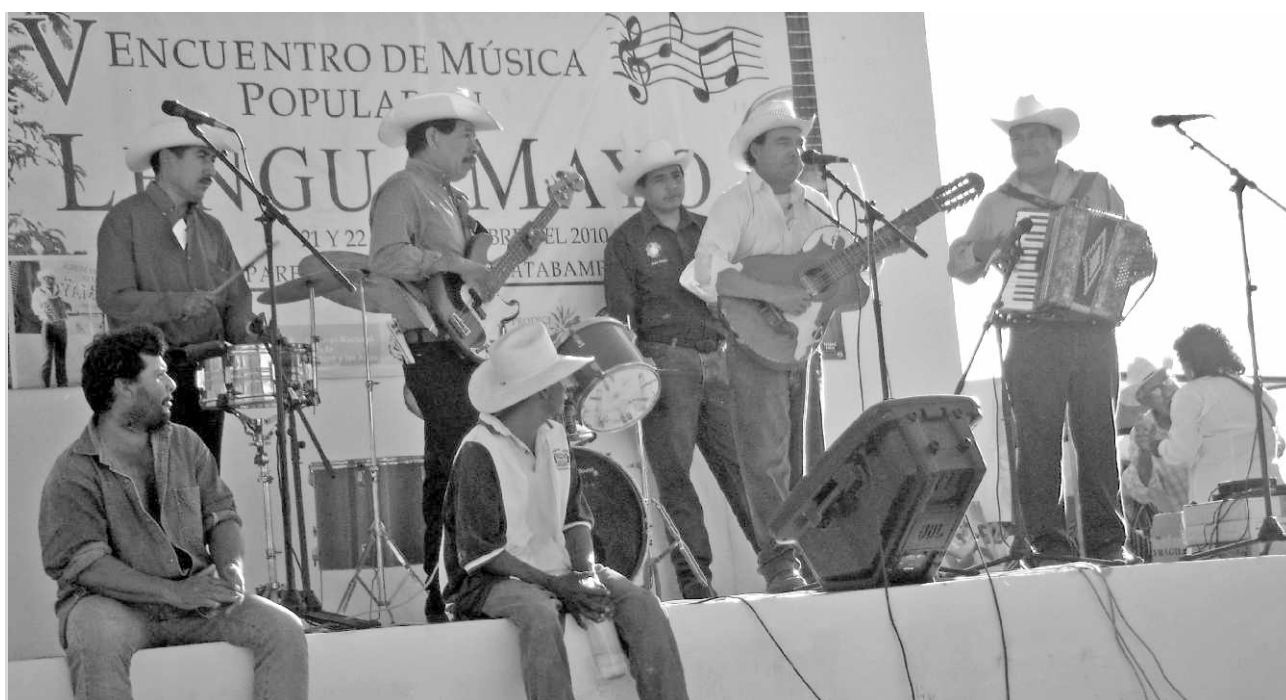
Músicos yoremes. Encuentro de música popular en lengua mayo, El Júpare, Huatabampo, Sonora.