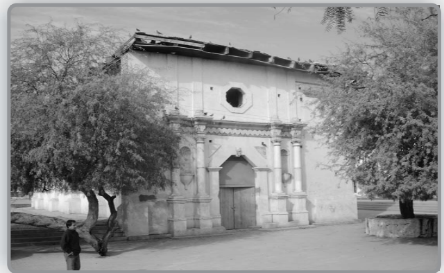
Templo de San Antonio de Padua localizado al poniente de Hermosillo

templo. 2) La adecuación de los espacios para la “sala de usos múltiples” destinando la nave como la sala del público, el presbiterio como escenario; en el coro la administración y en el sotocoro se destinó un espacio para la taquilla y recepción, pues es la capacidad que los espacios del edificio permiten utilizar, sin afectar su